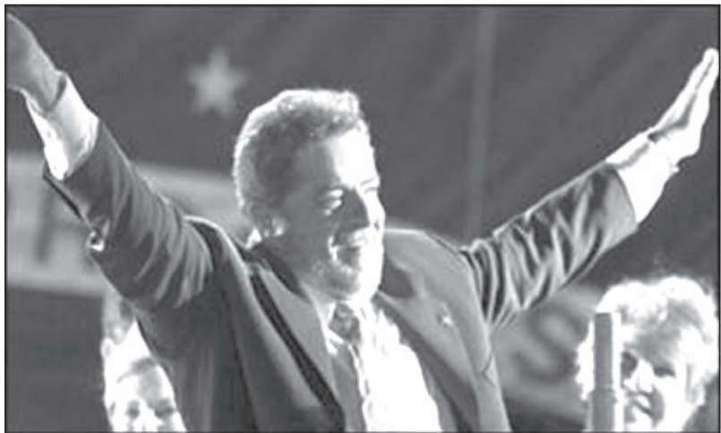
Lula's valgsejr skabte store forhåbninger om en anden Verden.