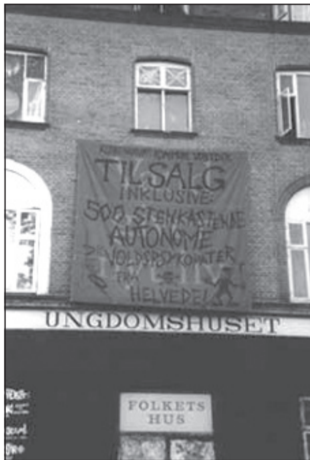
Ungdomshuset har fået faderhuset på nakken