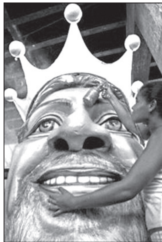
Lula statue ved Rio's karneval

Et godt eksempel herpå er PT-medlemmet Erundina, der blev valgt til borgmester i Sao Paulo, Brasiliens største industriby hvor PT har størst opbakning overhovedet. Hun blev valgt til borgmester på løfter om billigere offentlig transport og gratis måltider til skolebørnene. Byens pengekasse var imidlertid glubende tom, og Erundina måtte finde penge til sine reformer. Derfor privatiserede hun byens busselskab og skaffede derved penge til skolemad. Til gengæld blev flere buschauffører fyrede, og buspriserne steg til det dobbelte. Dette medførte voldsomme protester og strejker, fra arbejdere og buschauffører og 800 busser blev ødelagt i protest. Ved det næste borgmestervalg i Sao Paulo blev Erundina vraget til fordel for en kandidat fra det yderste højre. Selv i den by hvor PT havde størst opbakning, kunne Erundina ikke opretholde magten, da hendes politik ramte dem hun forsøgte at repræsentere. Spørgsmålet er om det vil gå Lula ligeså, og det afgørende er hvor hurtigt han kan gennemføre reformer og hvor omfattende de evt. bliver. Men når Lula har valgt