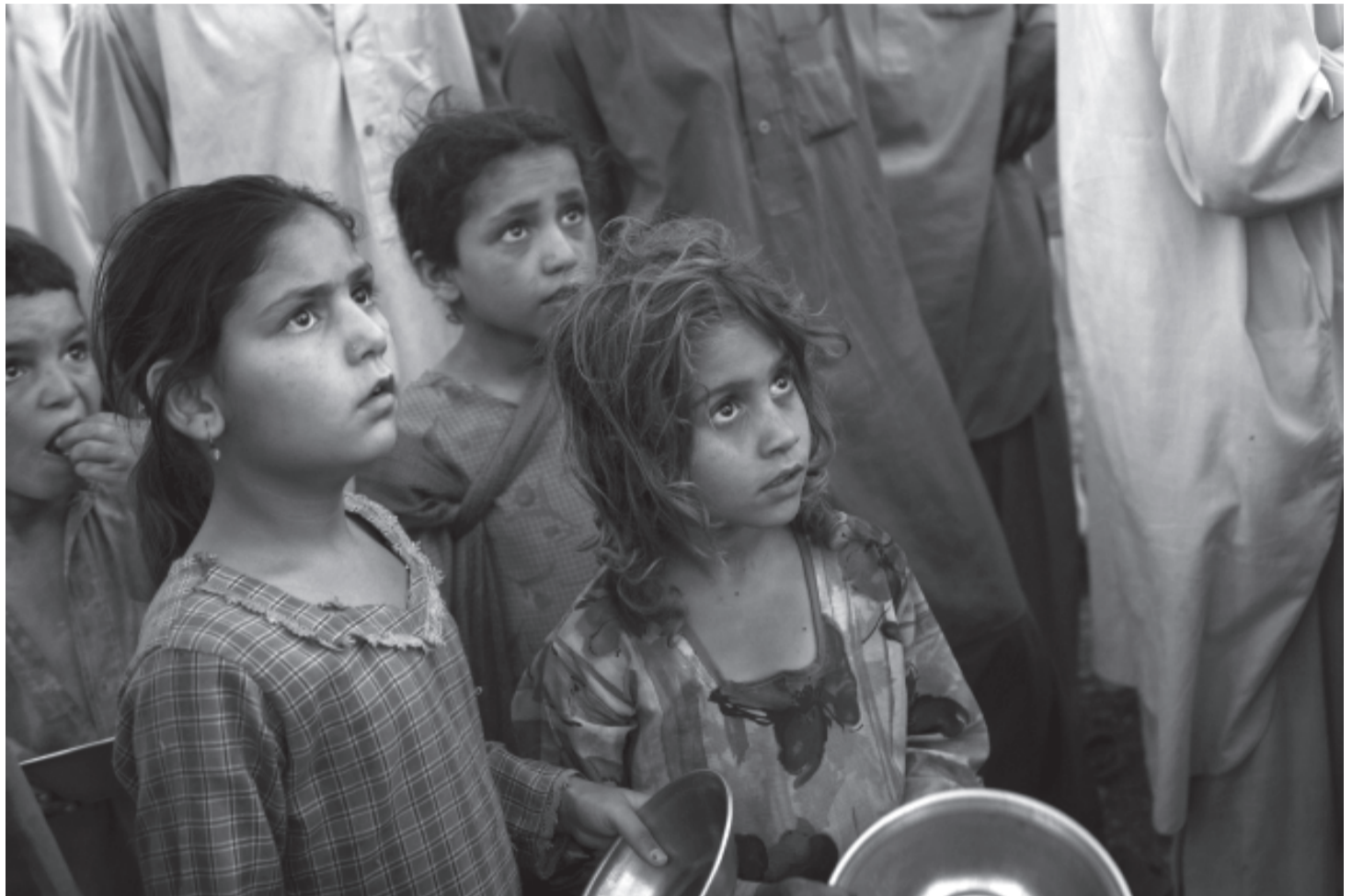
Uddeling af mad i en flygtningelejer i Swat-dalen.

Aktuelt er en skrøbelig fred blevet afløst af en frygtelig krig. De fattige klassers bekymringer bliver aldrig taget op ved fredsforhandlingerne. Således er TNSMs sharia-love en udfordring til de gamle magthavere, men