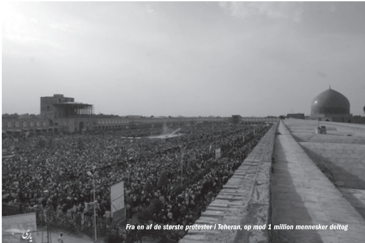
Fra en af de største protester i Teheran, op mod 1 million mennesker deltog

Han talte om den meget spændte situation inden den øverste leder, Ali Khameneis tale efter den kommende fredagsbøn – hvor han beordrede demonstranterne til at standse protesterne.