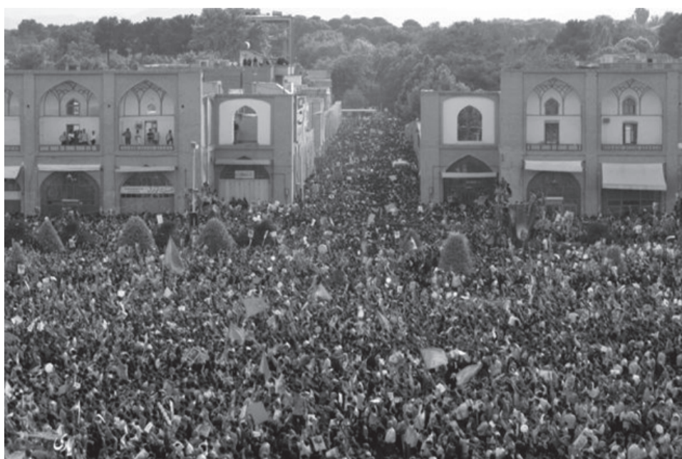
Millioner af mennesker har demonstreret i Iran

Politi og styrets militser angreb de protesterende. Demonstranterne svarede igen med at sætte busser i brand og bygge