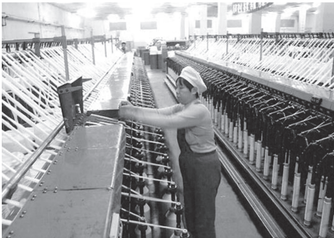
En arbejder i Halnan-provinsen producerer tekstil til eksport til USA

Det er dét mareridt, der stadig giver slagterne fra Beijing søvnløse nætter.