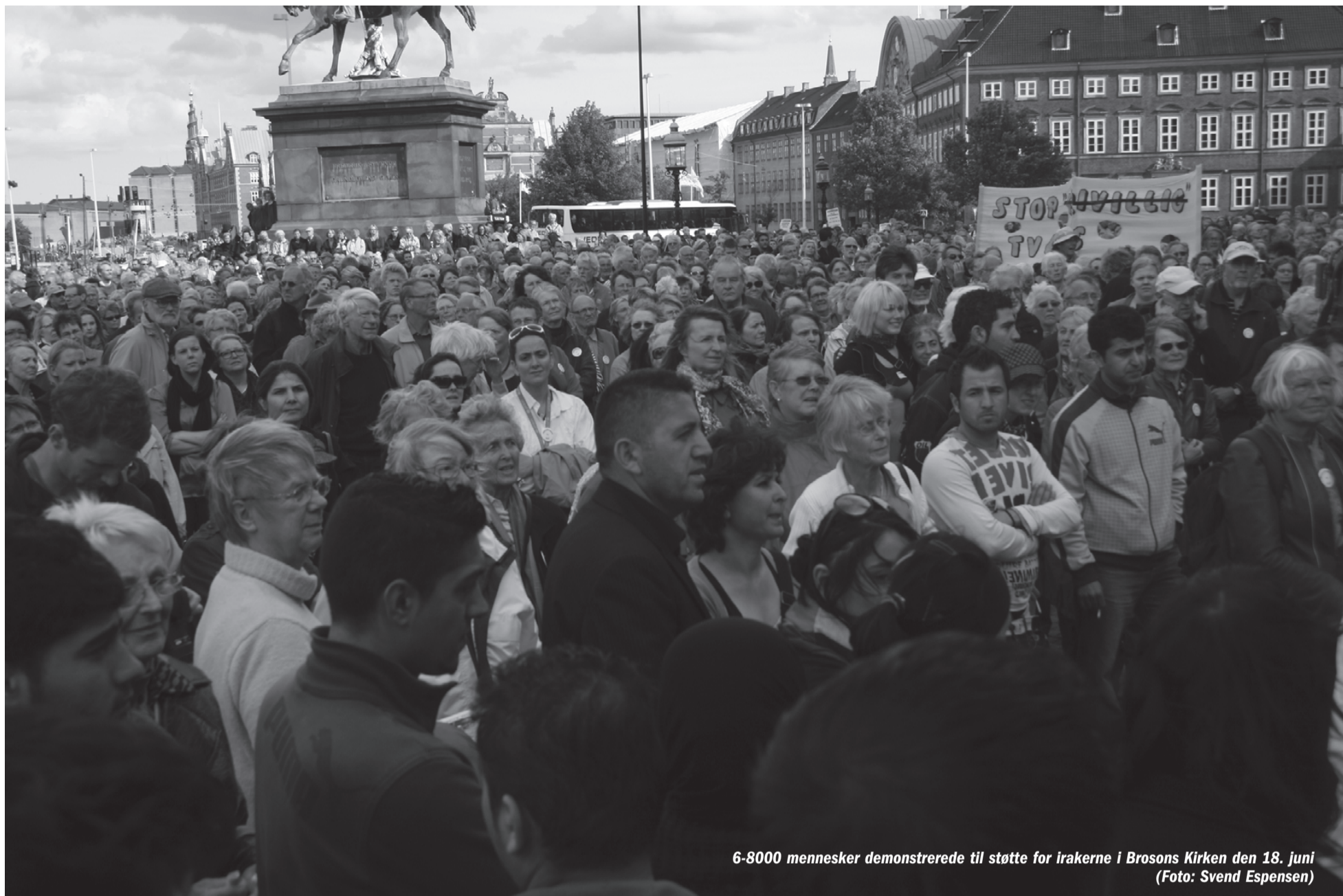
6-8000 mennesker demonstrerede til støtte for irakerne i Brosons Kirken den 18. juni