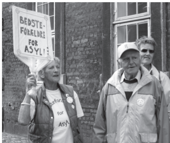
Bedsteforældre for asyl var meget aktive på støttedemonstrationen for irakerne i Brorsons Kirken

Der er flere forklaringer på Dansk Folkepartis sejr ved EU-parlamentsvalget. Men det viser tydeligt, at hetz imod muslimer stadig styrkes. Denne hetz har legitimeret store dele af regeringens politik. At stoppe denne hetz er med til at stoppe regeringen.