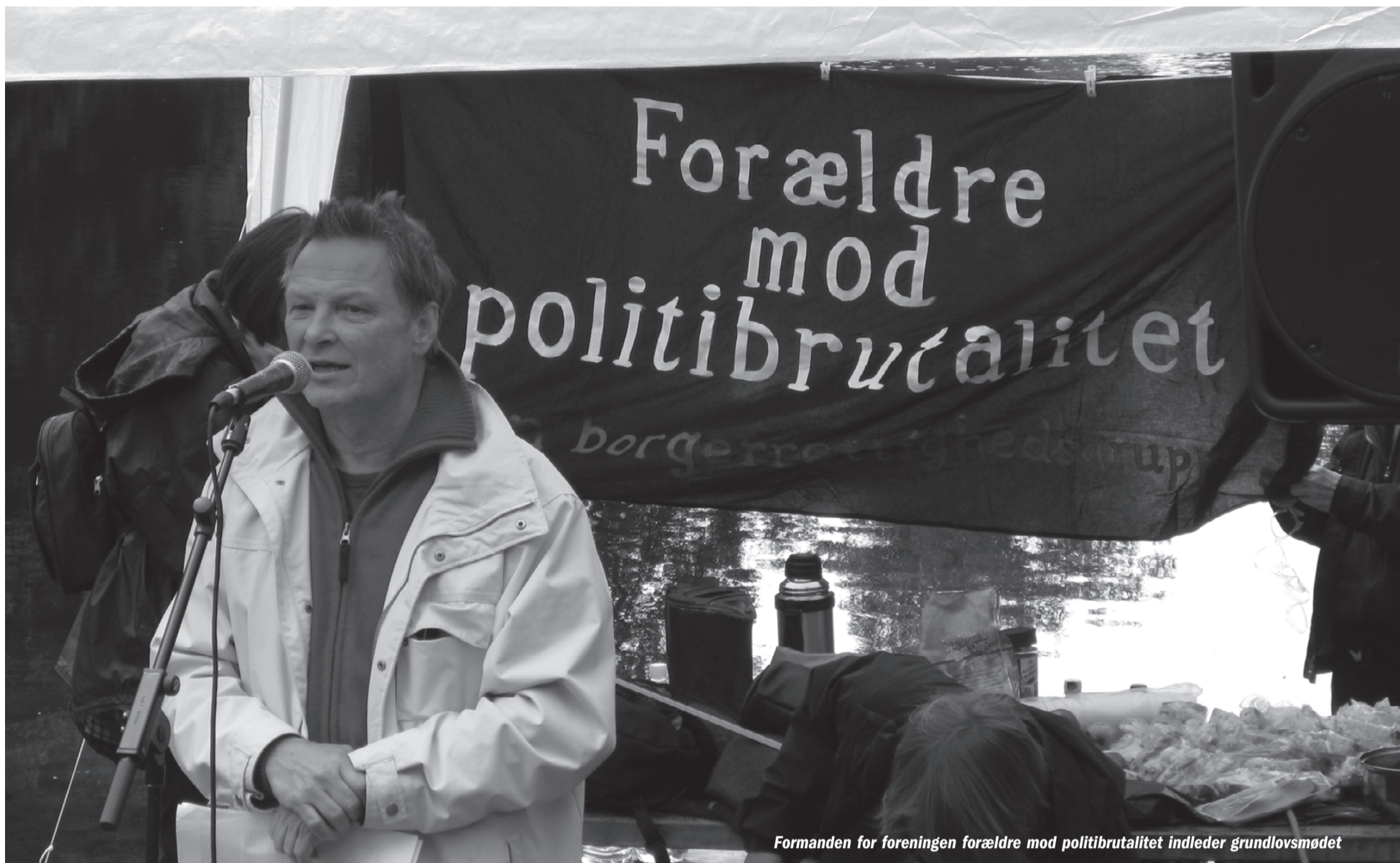
Formanden for foreningen forældre mod politibrutalitet indleder grundlovsmødet