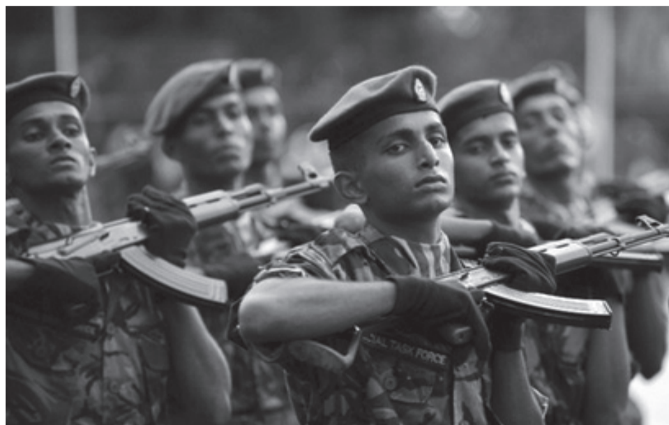
Sri Lankas hær har erobret alle de områder, som hidtil har været under de Tamilske Tigres kontrol.

Der er dog et håb. Hundre tusinder af tamilske flygtninge er begyndt at kæmpe. De permanente protester i London, som ofte er