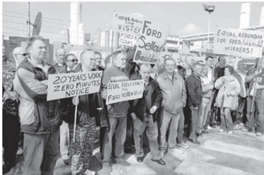
Protester ved Visteon i England

Man skal ikke romantisere 1930'erne. Det var et årti med hårde afsavn, der endte i en verdenskrig. Men det, at arbejdere stadig var i stand til at gå til modstand under sådanne omstændigheder, kan kun tjene til inspiration – også i dag, hvor en ny krise er i frem-march.