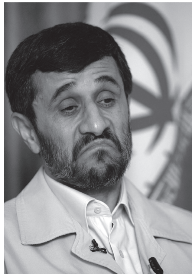
Ahmadinejad følte sig sikker på at vinde ved valget, han havde alle meningsmålinger på sin side.

Mousavi og andre reform-politikere ønsker at bruge den stigende uro i landet til at fjerne én fraktion af den herskende klasse fra magten. De ønsker Ahmadinejad og hardlinerne fjernet. Men de ønsker også at begrænse omfanget af den