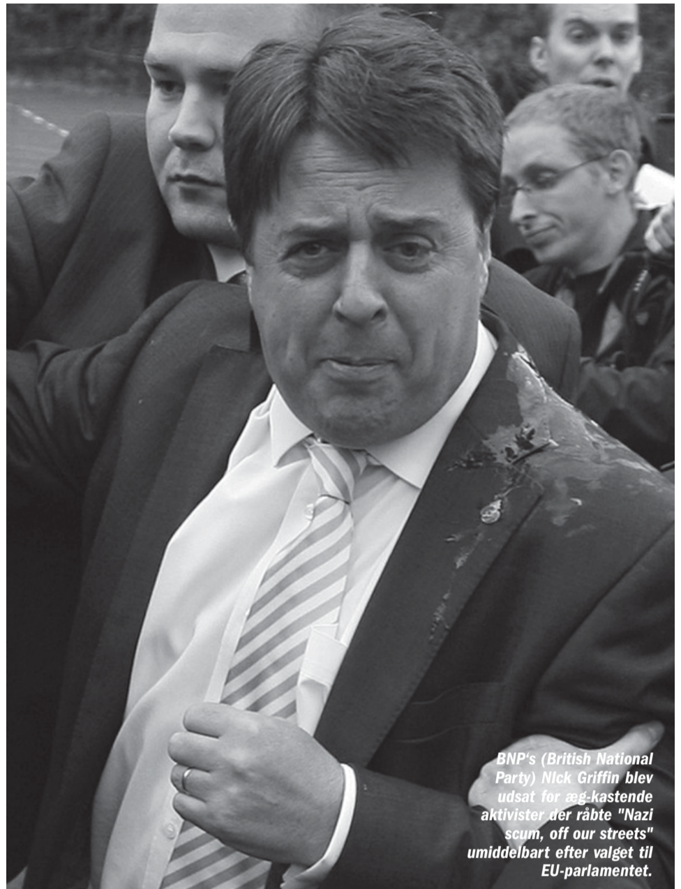
BNP's (British National Party) Nick Griffin blev udsat for æg-kastende aktivister der råbte "Nazi scum, off our streets" umiddelbart efter valget til EU-parlamentet.

Den dårlige nyhed er, at når venstrefløjen ikke er i stand til at blive et alternativ for langt flere, så står racistiske og nazistiske