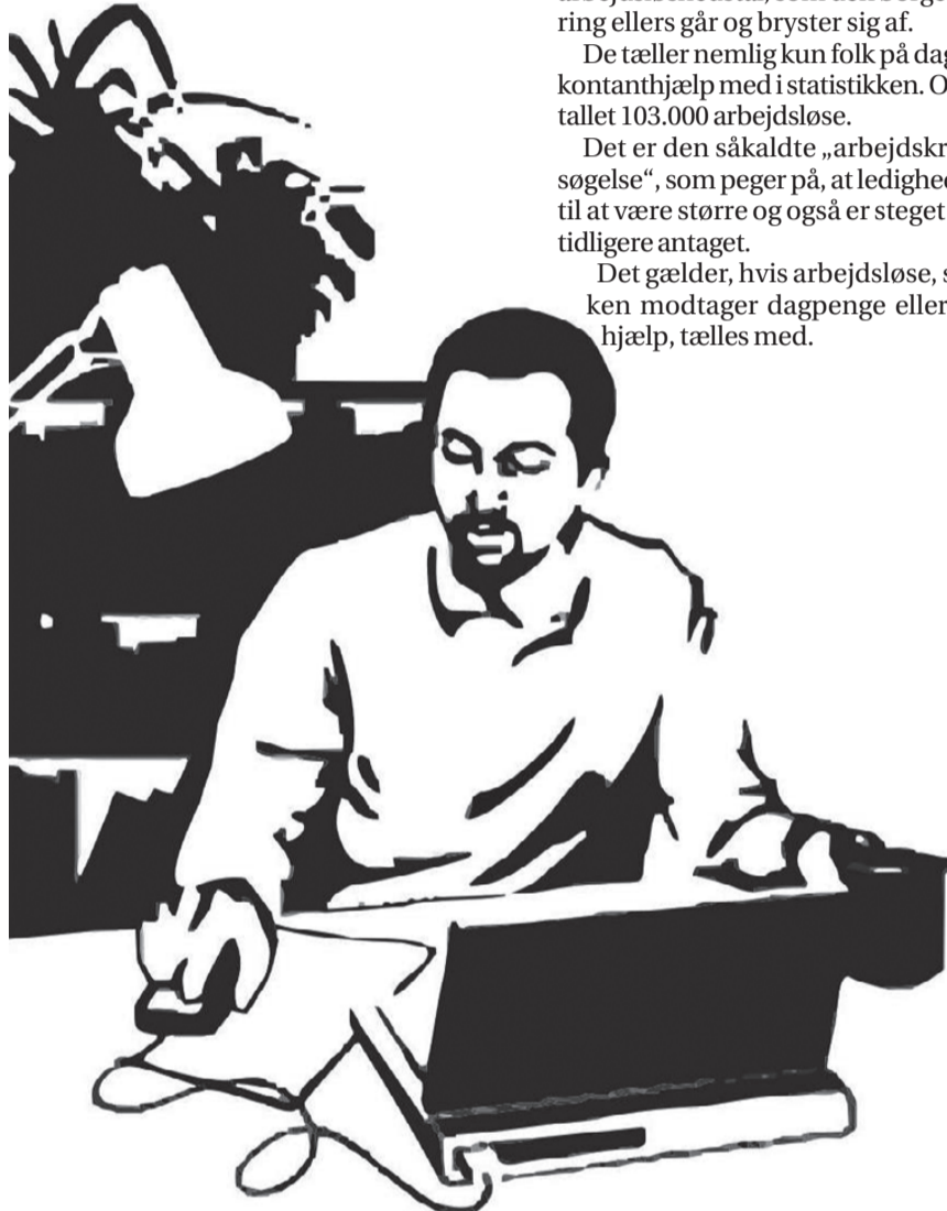
816.000 står uden for arbejdsmarkedet, der er gang i ansøgningerne