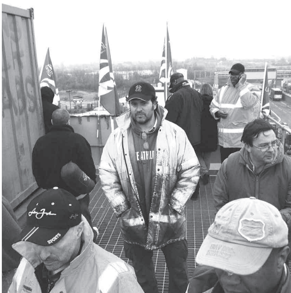
Visteon arbejdere (nederst) besatte deres fabrikker efter at de var blevet fyret – aktioner der betød et vendepunkt i den engelske klassekamp.

kontinuerlige angreb på arbejderklassen.