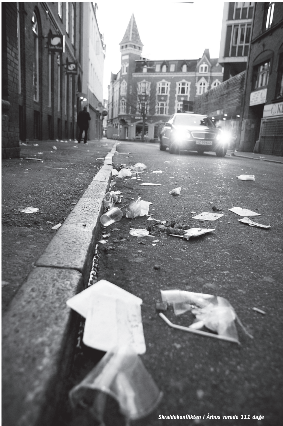
Skraldekonflikten i Århus varede 111 dage

Det kan være svært at forstå, at nogle skal arbejde meget