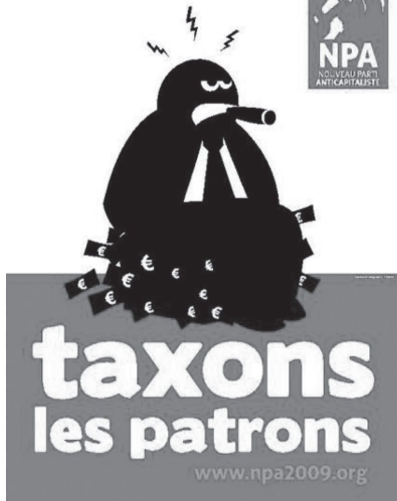
Beskat direktøren – er sloganet på en af NPA's plakater

start. Stemningen var afslappet, mens der blev diskuteret politik i sommerlejren tæt ved Middelhavet.