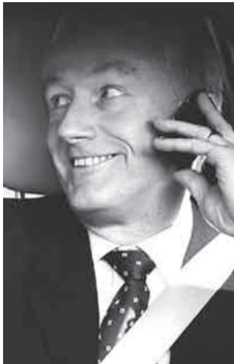
Royal Bank of Scotlands direktør Sir Fred Goodwin's (øverst) har fået sikret sin pension, alt imens millioner af arbejdere er bekymrede for deres pensions forhold.

Den eneste måde, hvorpå politikere og økonomer kan forestille sig at løse gældsproblemet, er ved massive nedskæringer. Det betyder, at vi er på vej ind i en periode med