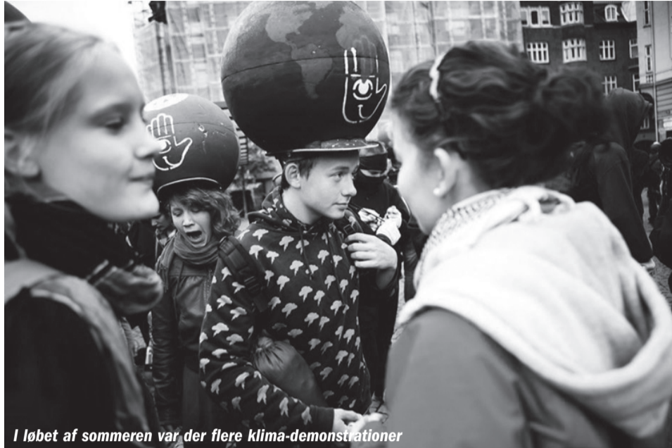
I løbet af sommeren var der flere klima-demonstrationer

Men mens mange af de sultende i Afrika er for svage til at slå igen, så rammer klimatrusslen mange andre, som ikke har mistet evnen til at slå. Thailand og Indonesien, Nigeria og Brasilien er blot et par eksempler.