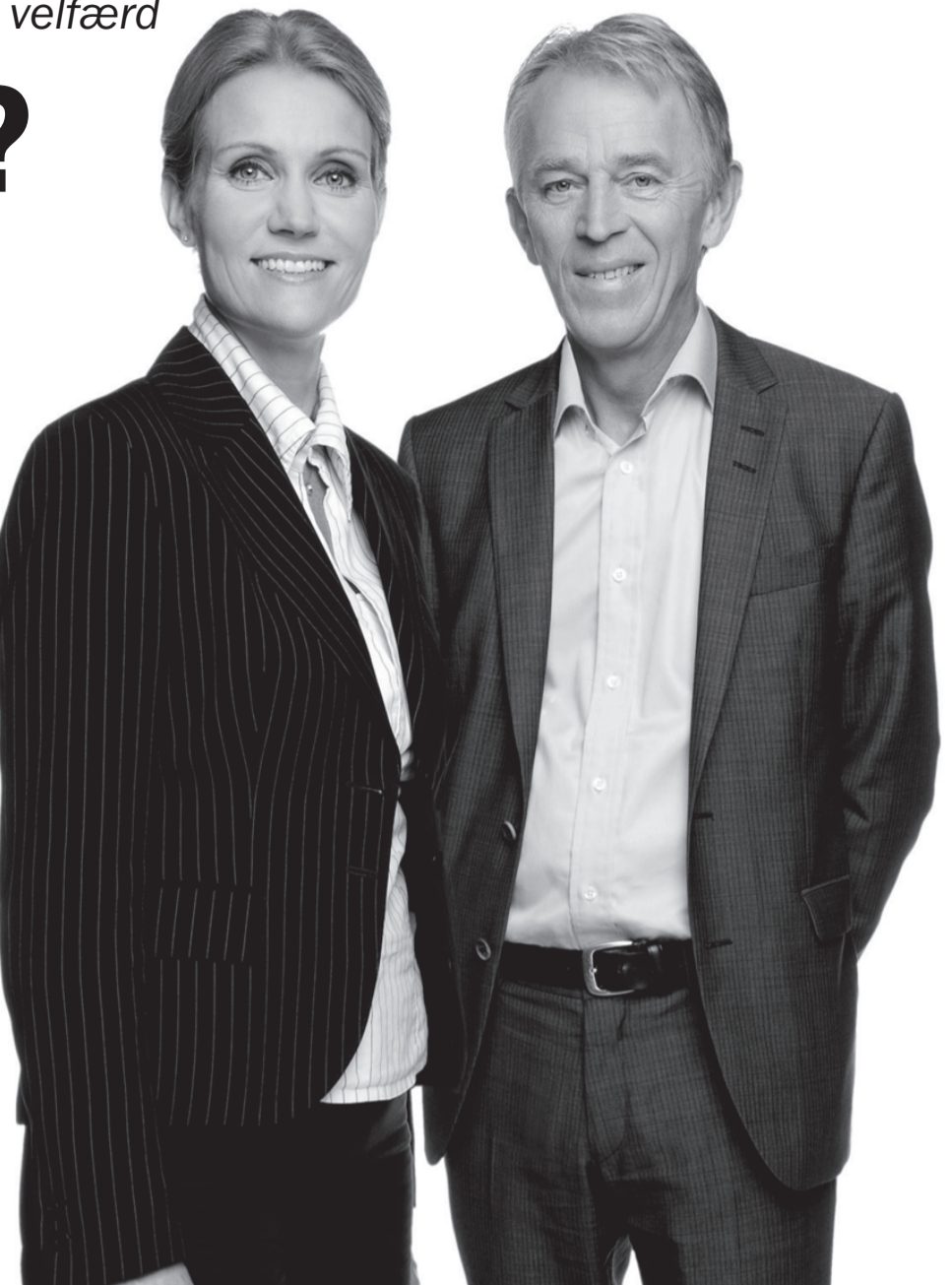
Helle og Villys forslag til skattereform er stort set en fortsættelse af VKO's politik

6% mere i skat for alle, som tjener over en million (tilbage til niveauet før Rødvinsreformen). Det drejer sig om ca. 25000 mennesker i Danmark. Pensionister får 5000 kr. mere om året. Og folk i arbejde får et fradrag på 6000 årligt. Der gives en saltvandsindprøjtning til skoler og sygehuse. Der sker en lille forhøjelse af selskabsskatten (tilbage til niveauet før Rødvinsreformen på 28%) Det bliver ikke længere muligt at