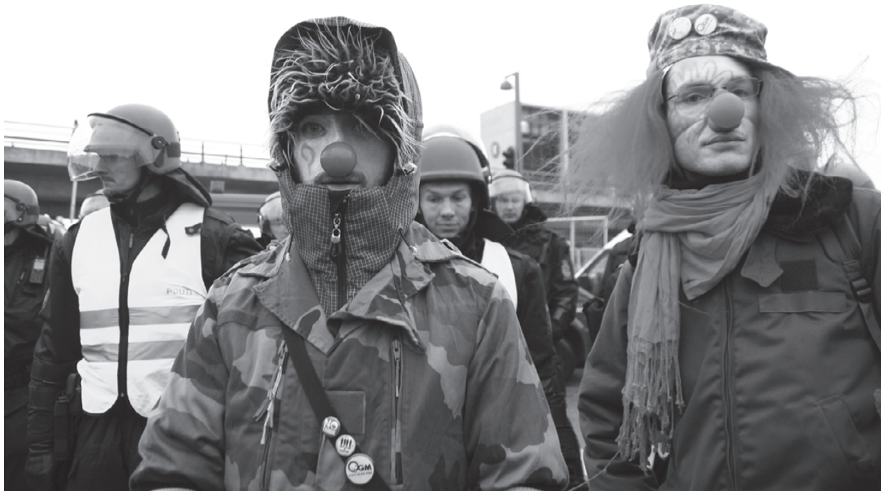
Direkte aktioner kan være rigtige, især når de kombineres med en større bevægelse.

Direkte aktioner kan ikke stå alene. Hvis det var lykke-