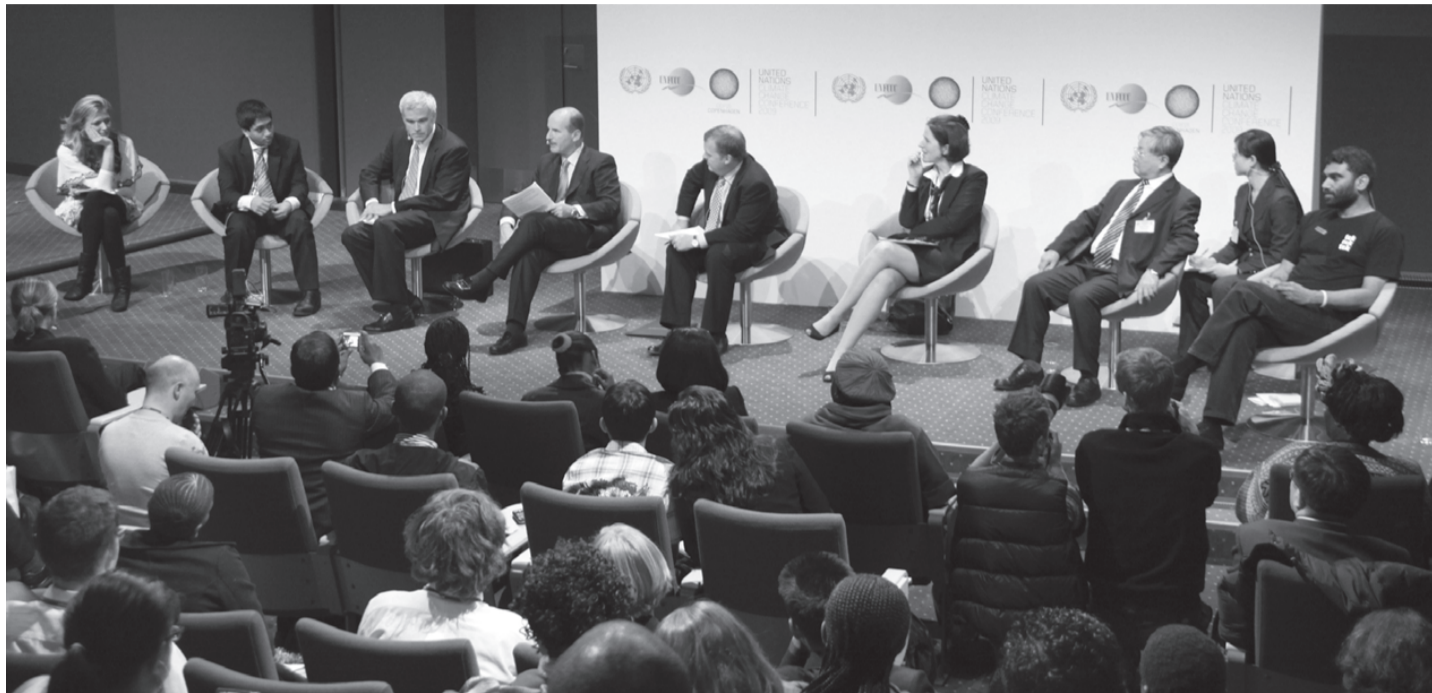
Lars Løkke (i midten) i „dialog“ med en række NGO'ere ved COP15.

Det er vist gået op for de fleste, at der ikke kom nogen aftale ud af klimatopmødet i København. Til gengæld er der vild forvirring om, hvad der egentlig skete.