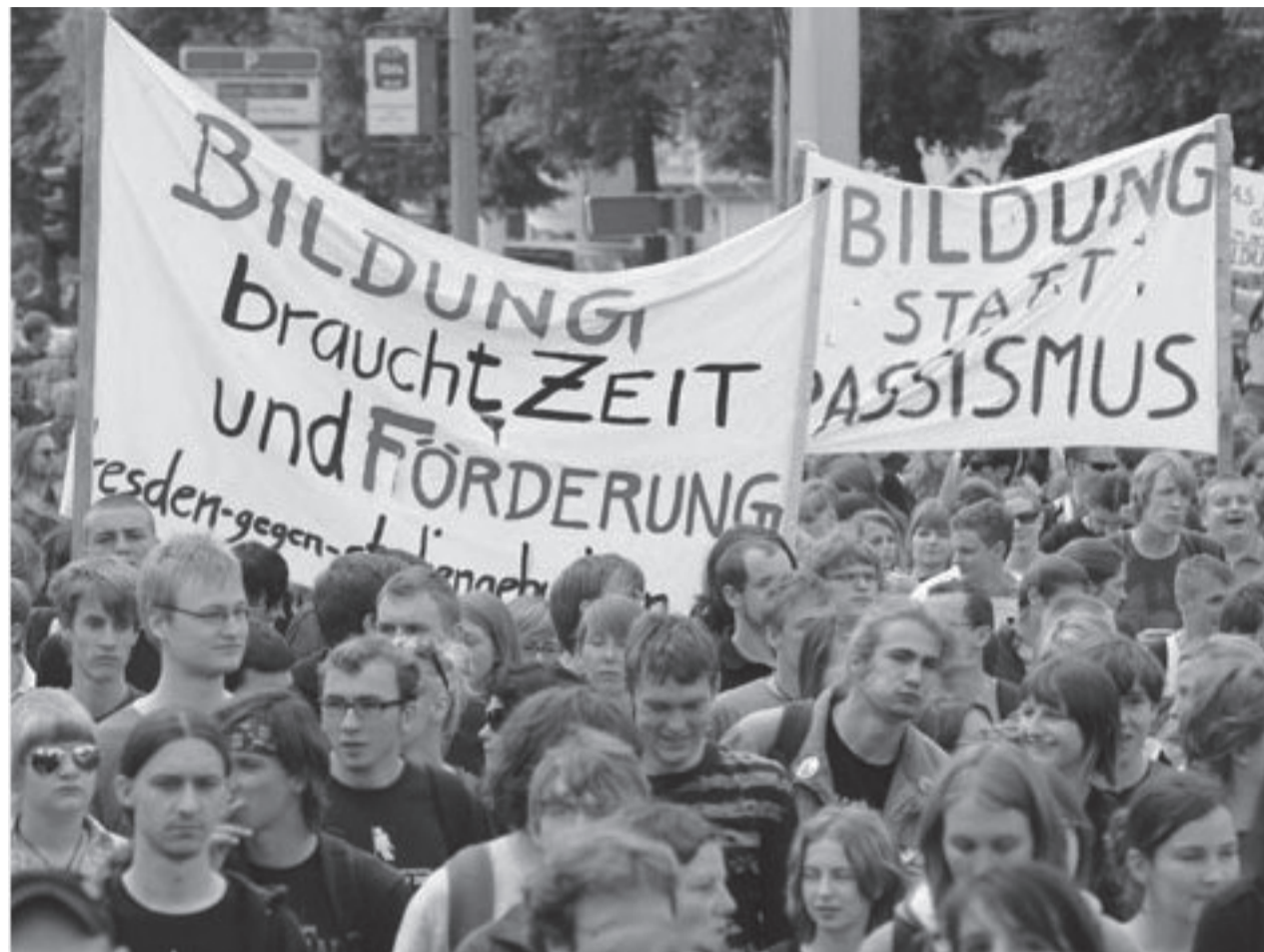
Den østrigske regerings forsøg på at gennemføre nedskæringer og nyliberale reformer på landets universiteter har skabt massive protester.

Gennem de sidste måneder er en bølge af studenterprotestbevægelser skyllet over det centrale Europa, med centrum på universitet i Wien. Her har tusinder af studerende, ansatte, undervisere og lægfolk holdt universitet besat siden oktober. Blokaden har været støttet af fagforeninger, og bevægelsen har reelt været en folkeligt rodfæstet protest.