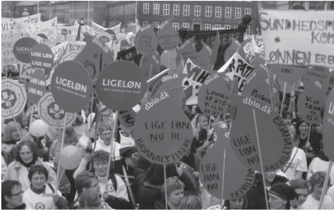
Storkonflikten i 2008 indenfor dele af det offentlige område – KTO – blev udløst af et voldsomt pres fra neden

Overenskomstforhandlingerne for de 600.000 privatansatte er netop skudt i gang. Arbejdsgiverne går efter en nulløsning, og fagbevægelsens top har allerede kastet håndklædet i ringen og erkendt 'mådehold og ansvarlighed'. Men både arbejdsgiverne og fagtoppen ved godt, at jokeren i overenskomstpillet som altid er arbejderklassen! Hvad vil de 600.000 privatansatte acceptere?