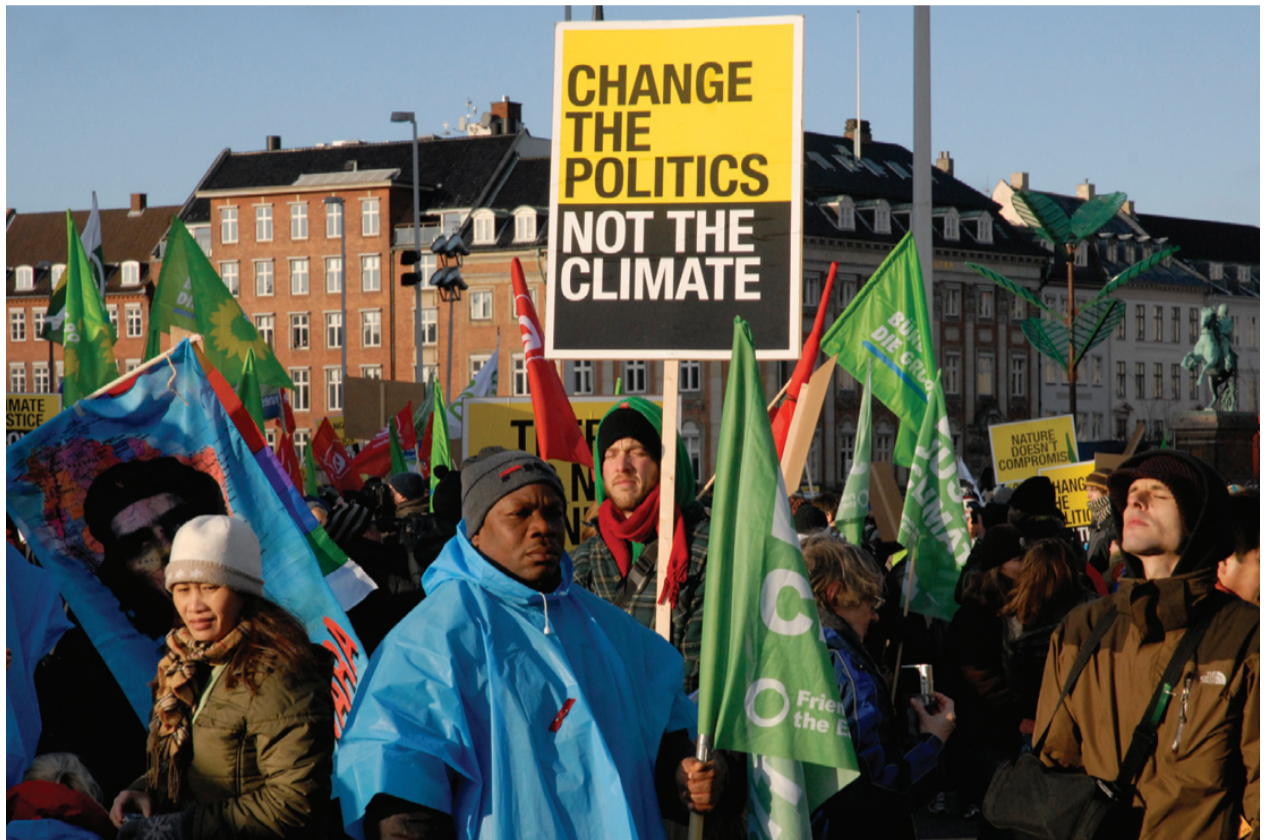
Med 100.000 deltagere blev demonstrationen ved klimatopmødet 12. december langt større end nogen af os havde turdet håbe på.

Start med at ringe til dem, du kender og som var med –