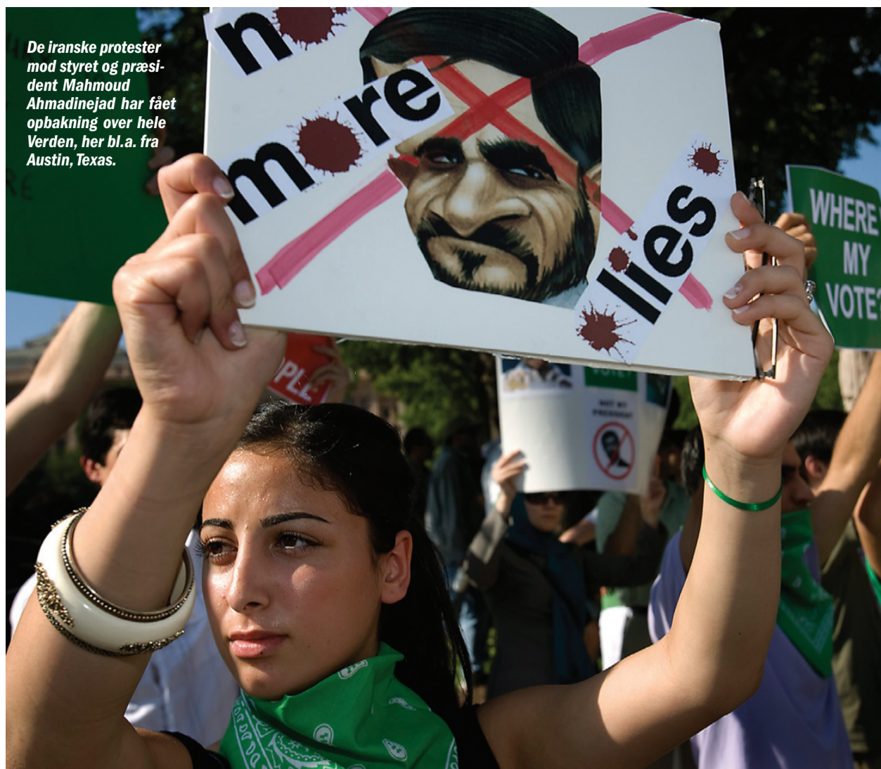
De iranske protester mod styret og præsident Mahmoud Ahmadinejad har fået opbakning over hele Verden, her bl.a. fra Austin, Texas.

(forkortet af pladshensyn, læs resten på information.dk )