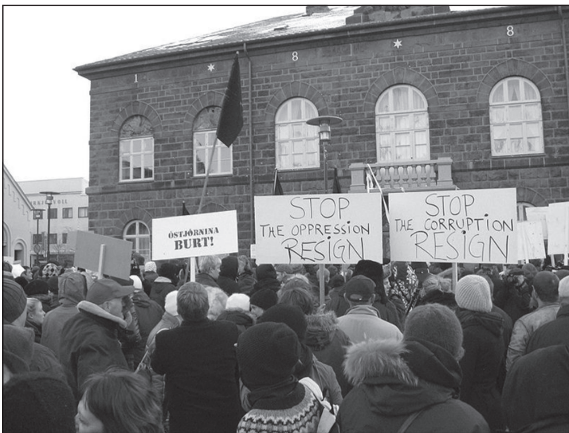
Omkring 70.000 islændinge har på skrift givet udtryk for deres utilfredshed med at skulle undgælde for nogle få personers uansvarlige spil med landets værdier.

McDonalds har forladt landet. Basale fødevarer er blevet meget dyrt. Selv „skyr“, islandsk nationalspisefødevarer af tørret kød med lavt fedtindhold og højt proteinindhold, som har været spist af næsten alle i Island siden det tiende århundrede, er blevet for dyrt i sine bedre tider. Det samme er en anden islandsk specialitet, tørret fisk. I hovedstadens loppemarked, Kolaport, sælger fødevarerproducenter direkte til de mennesker, som ikke har råd til at handle i supermarkeder. Markedet startede i 1980'erne som et par boder, der er nedsat i en underjordisk parkeringskælder. Det blev så populært, fordi det var nødvendigt - men det er stadig ikke nok. Mellem 1.500 og 2.000 familier i Island accepterer fødevarer hver måned - men i december