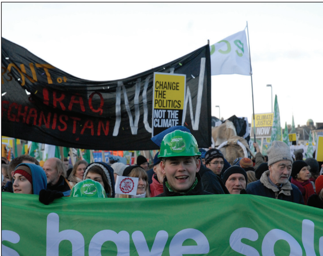
Demonstrationen afspejlede i høj grad den diversitet, der var blandt demonstranterne. Både i forhold til indgangsvinkel til klimaspørgsmålet og løsningsmuligheder.