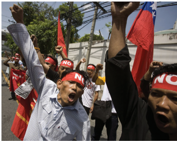
THAILAND: massive protester mod regerings og mediernes løgne om, at rødskjorterne ikke repræsenterer flertallet.

Den politiske krise og uro, som vi har set i Thailand siden militærkuppet mod Taksins demokratisk valgte regering den 19. september 2006, repræsenterer en voldsom klassekamp mellem de rige konservative, og de fattige fra byerne og landet. Det er ikke en ren klassekamp, og de, der deltager, har forskellige mål og forskellige opfattelser af demokrati.