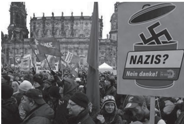
15.000 antidacister blokerede nazi-demonstration i den tyske by Dresden

Om morgenen d. 13. februar trodsede flere tusinde