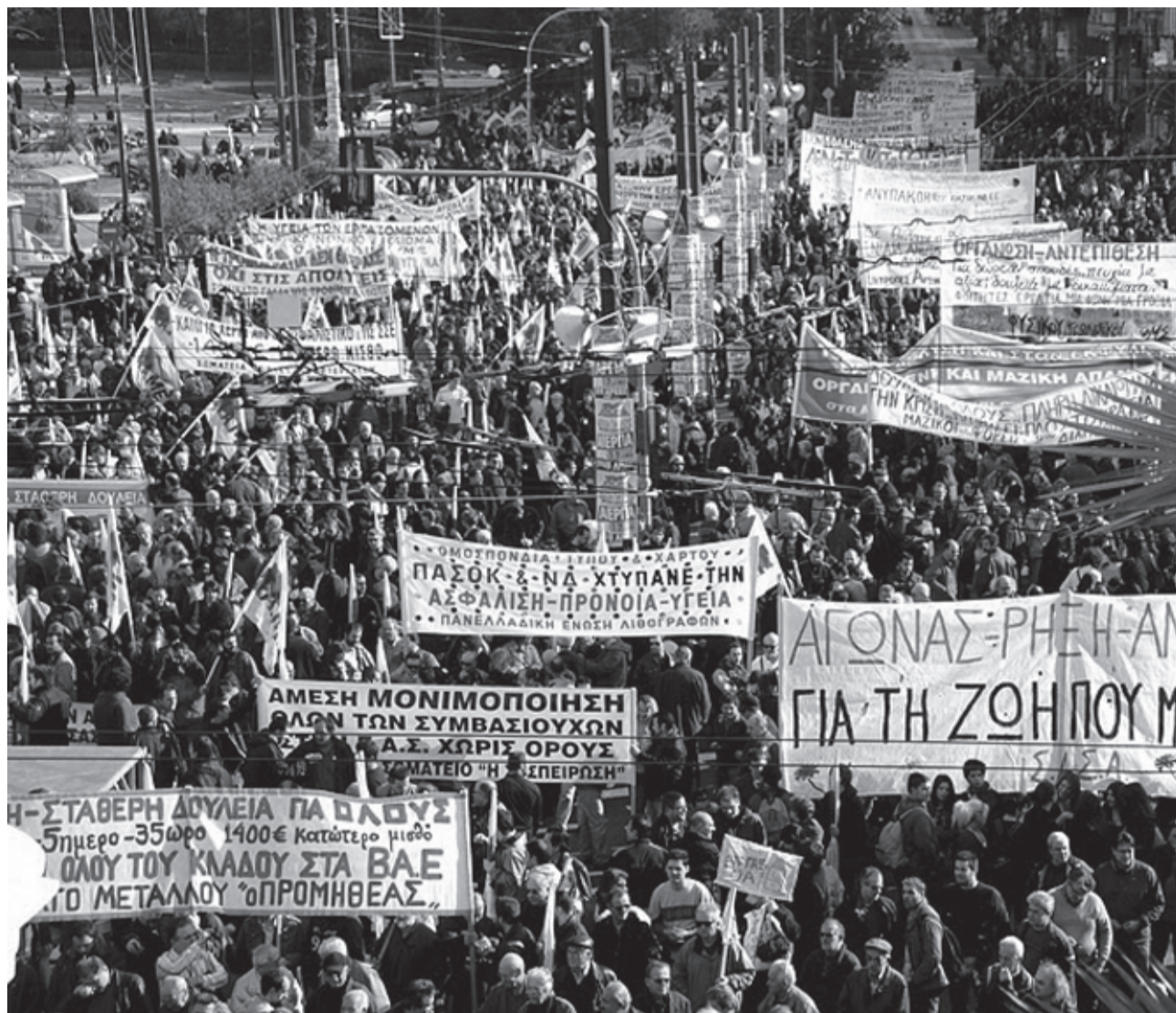
I Grækenland har vi set de hidtil største protester