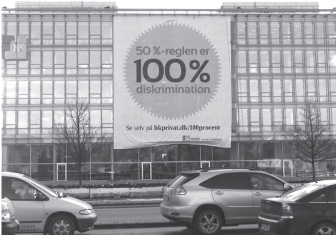
Mange tusinde funktionærer fra HK må stadigvæk leve med, at overenskomsten ikke gælder for dem på grund af at 50 %-reglen ikke blev fjernet.