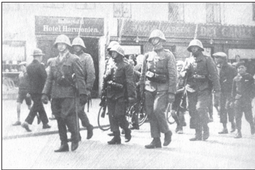
Arbejdsløshedsprotesterne i Nakskov i 1931 var så store og omfattende at militæret blev sat ind.

I Nakskov var en stor del af byens arbejdere arbejdsløse i begyndelsen af 1931, og mange havde opbrugt deres understøttelse, hvilket betød, at byens hjælpekasse var ved at være tom.