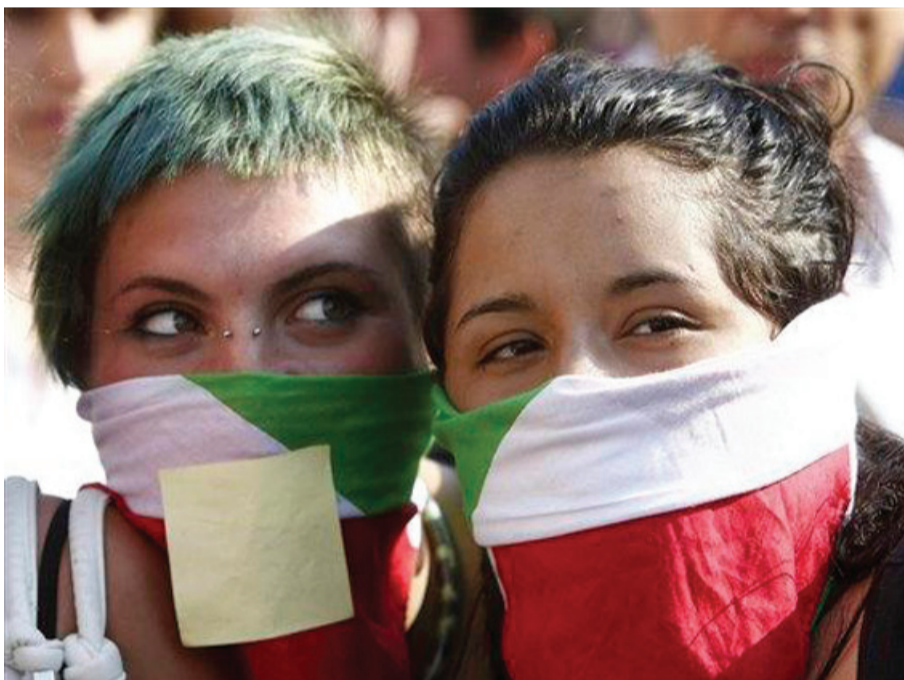
Øverst: Protest i Paris mod højere pensionsalder. Midterst og nederst: fra protesten i Rom 25. juni