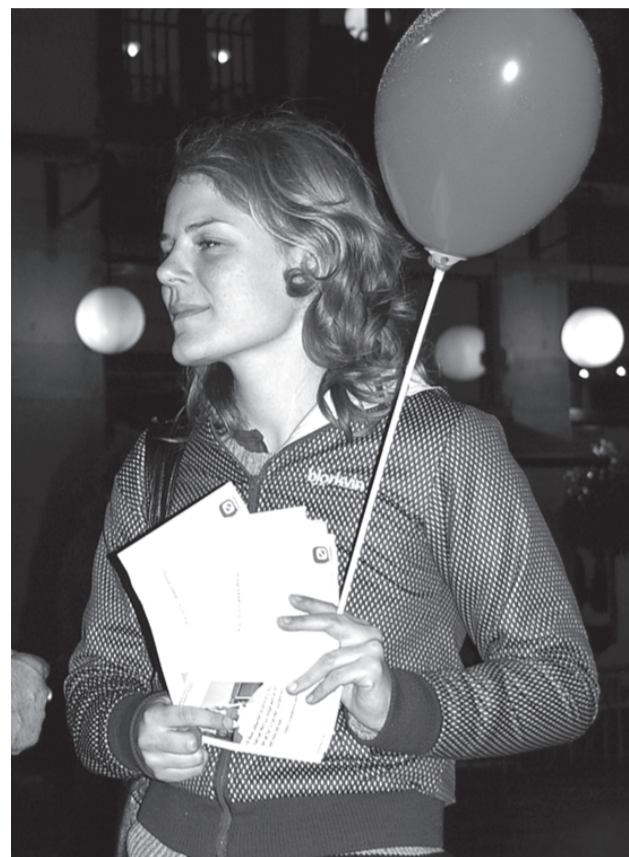
I en mail til alle medlemmer skriver Johanne Schmidt-Nielsen: „Senest havde vi – efter hårdt pres – succes med at få de to partier til at melde ud, at de efter et valg vil tage udgangspunkt i den nuværende dagpengeperiode på fire år frem for i Lars Løkkes discountmodel“

I forbindelse med demonstrationen 2. juni strejkede bl.a. portørerne på Rigshospitalet samt havne- og stilladsarbejdere i Århus. Til demonstrationen 8. juni var der også flere strejker. Der har været medlemmer af Enhedslisten