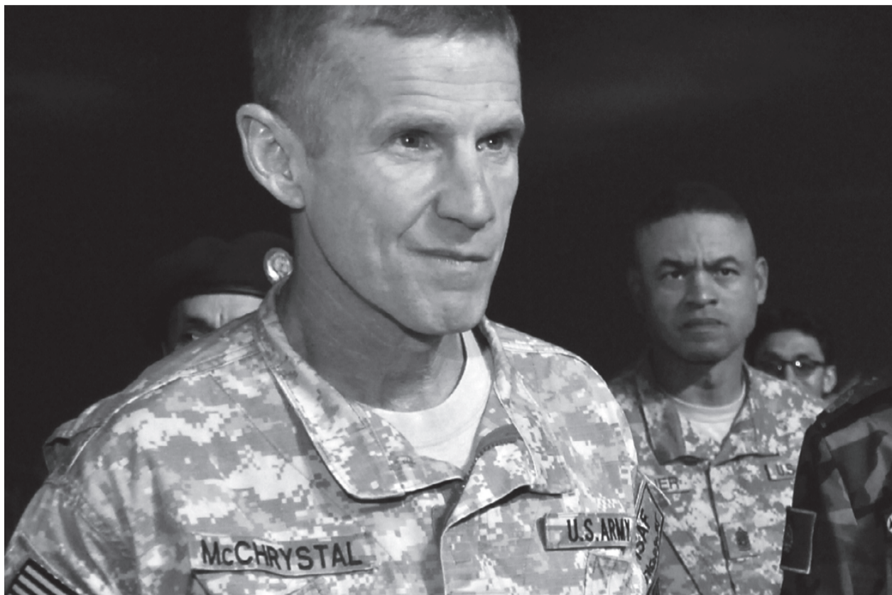
Fyringen af general McChrystal hjalp ikke Obama af med problemerne i Afghanistan, krigen er der stadigvæk

Den mest slående passage i Rolling Stone -artiklen er beskrivelsen af tilstanden i krigen i Afghanistan, ikke McChrystals angreb på det Hvide Hus: