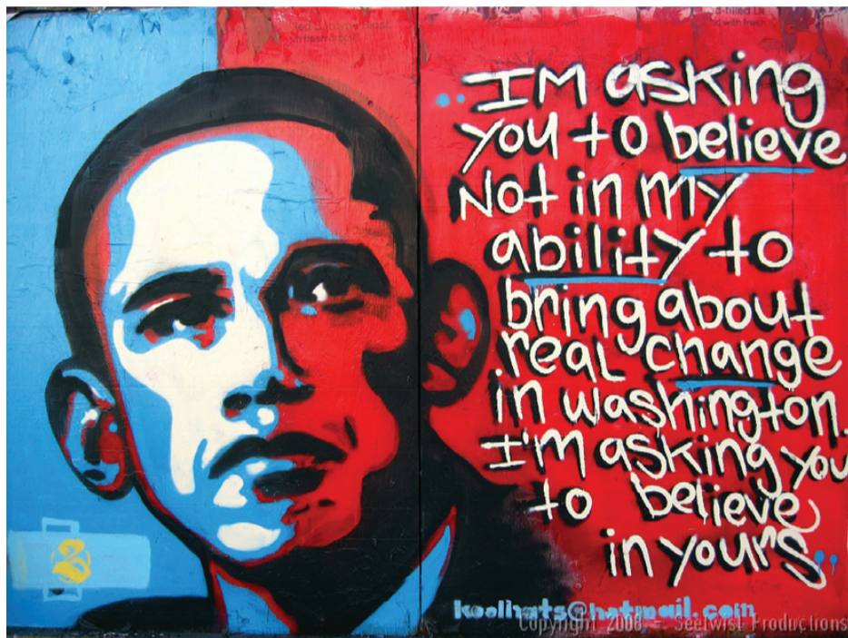
Obama bragte håb til mange. Men han kan ikke opfylde deres drømme.

USA-koalitionen har nu flere regulære tropper (over 120.000) i Afghanistan, end russerne havde, da de havde flest. Tæller man contractors (lejesoldater) med, er tallet over 160.000. Russerne tabte som bekendt, og Obama må indstille sig på, at han fører en krig, han ikke kan vinde.