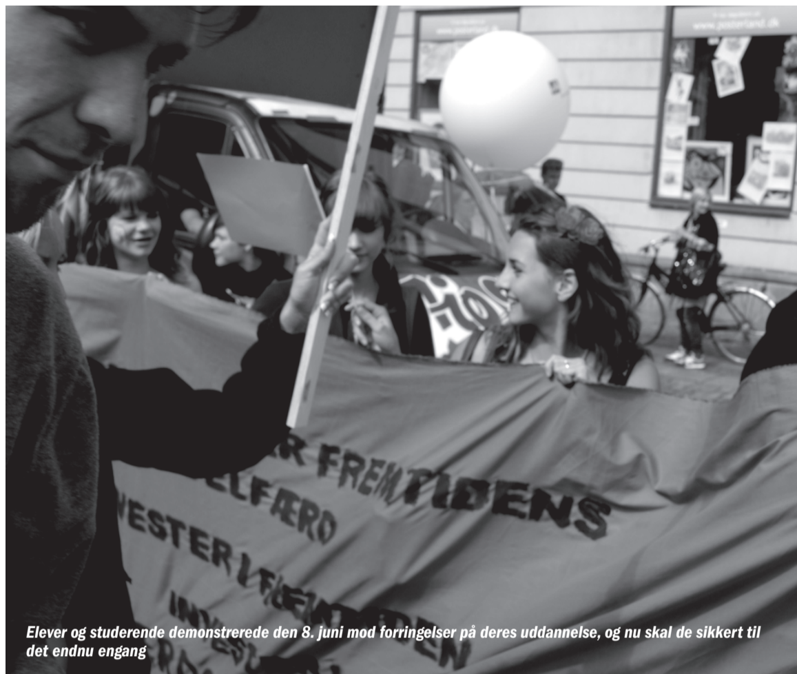
Elever og studerende demonstrerede den 8. juni mod forringelser på deres uddannelse, og nu skal de sikkert til det endnu engang