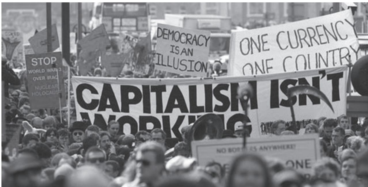
„Capitalism isn't working“ – noget tyder på at udsagnet er rigtigt. Billedet er fra protesterne ved det nyligt afholdte G8/G20-topmøde i Toronto, Canada.

Resultatet af krisen er ikke en mere samlet magthaverelite. Tværtimod ser vi i dag en mere splittet og konkurrerende elite. Når de gang på gang taler om landes konkurrenceevne siger de grundlæggende, at det er de andre