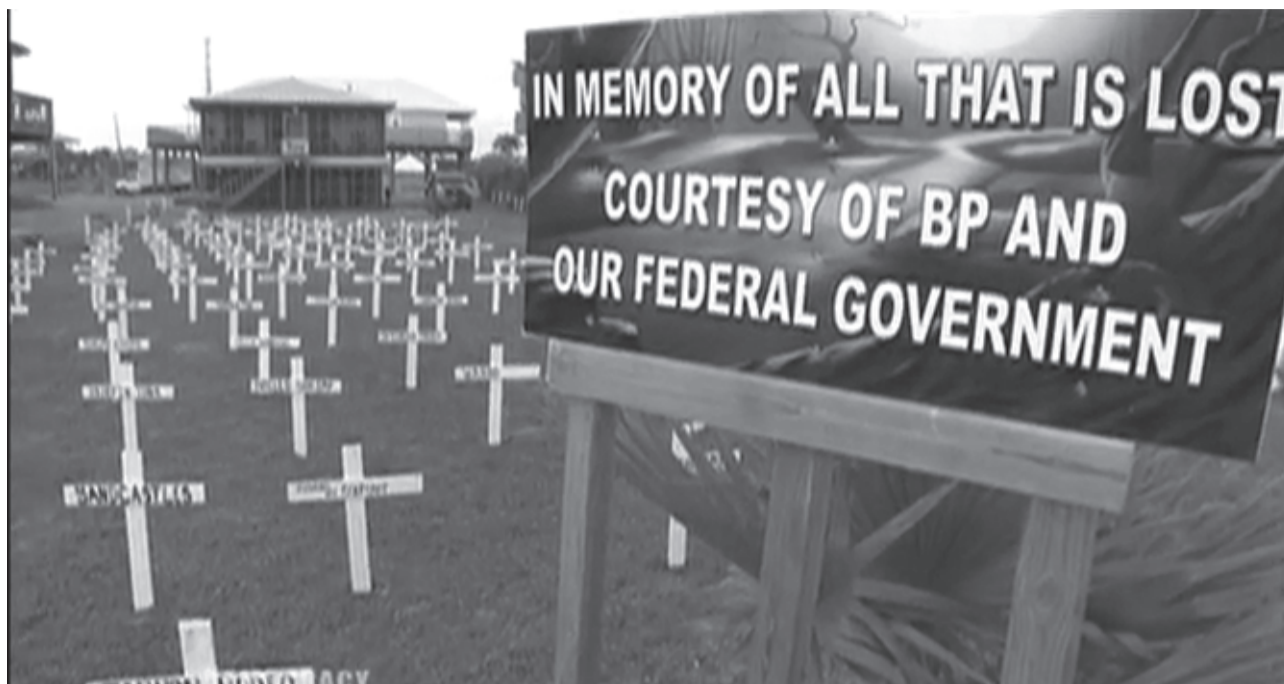
Mange steder langs USA's sydkyst ser man små protester som denne i Grand Isle, Louisiana: „Til minde om alle de ting vi har mistet – takket være BP og forbundsregeringen“. På de hvide kors står der fx „sand mellem tæerne“, „refjiskeri“, „tun“, „stranden“, „sandslotte“ osv.

Obama 2. april: „I dag er olieplatforme generelt ikke årsagen til oliespild. De er teknologisk meget avancerede.“ Udtalelsen kom kun 18 dage før eksplosionen på Deepwater Horizon .