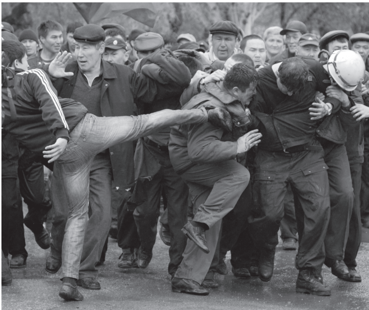
To betjente får tæv under en demonstration i Kirgisistan

Også i Ukraine har USA tabt indflydelse, efter at den pro-vestlige præsident Yushchenko tabte præsidentvalget i februar i år. Yushchenko kom til magten under den såkaldte Orange-revolution i 2004, hvor en større folkelig opstand