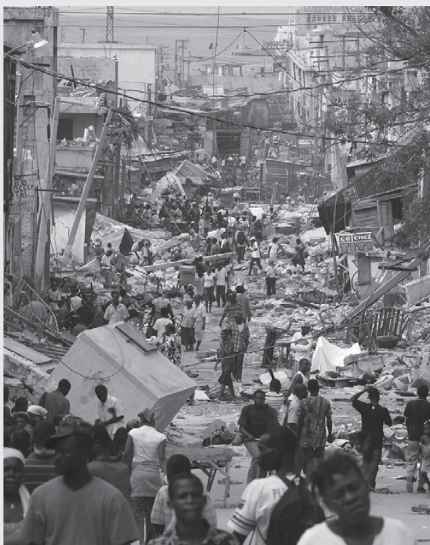
1.1 million mennesker er stadigvæk hjemløse, her 6 måneder efter jordskælv

Der er nu opført 5.000 ud af de lovede 125.000 midlertidige hjem til dem der har mistet deres bolig, men man har ikke kunnet finde egnet jord at bygge dem på. Overklassen vil ikke af med den gode jord, men sælger til gengæld dårlig jord til overpris, og sørger ved samme