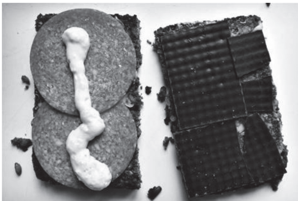
Københavnske forældre fik fornylig sat en stopper for en upopulær madordning

„Som offentligt ansatte, og ikke mindst som pædagoger, har vi en pligt til at forsvare dem,