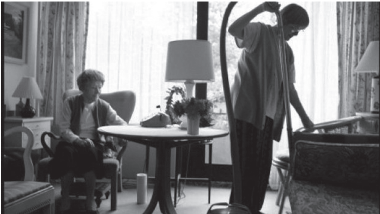
TV2 har haft held til at udbrede den holdning, at de dovne og uærlige hjemmehjælpere snyder de ældre for egen vindings skyld på fællesskabets bekostning.

Og det er ikke det der er det egentlige problem. Det store