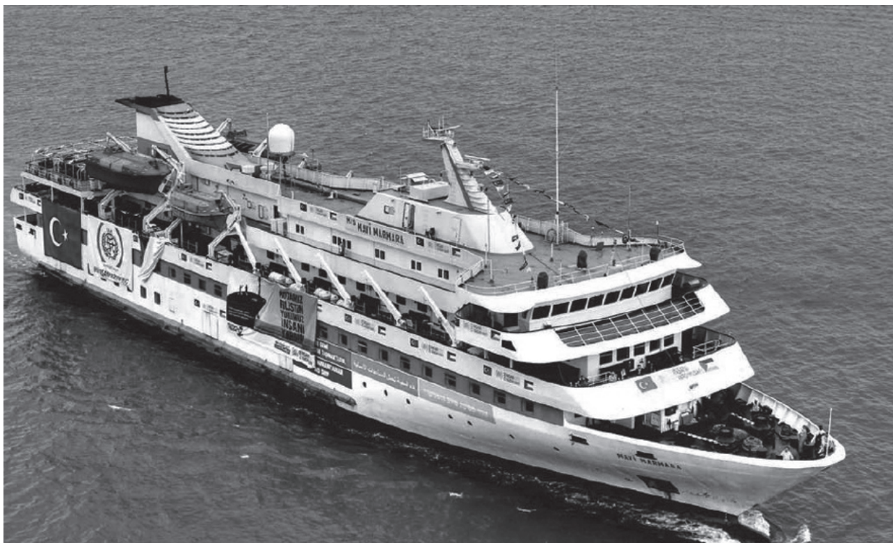
Ni mennesker blev dræbt, da israelsk militær bordede nødhjælpsskibet Marvi Mamara.