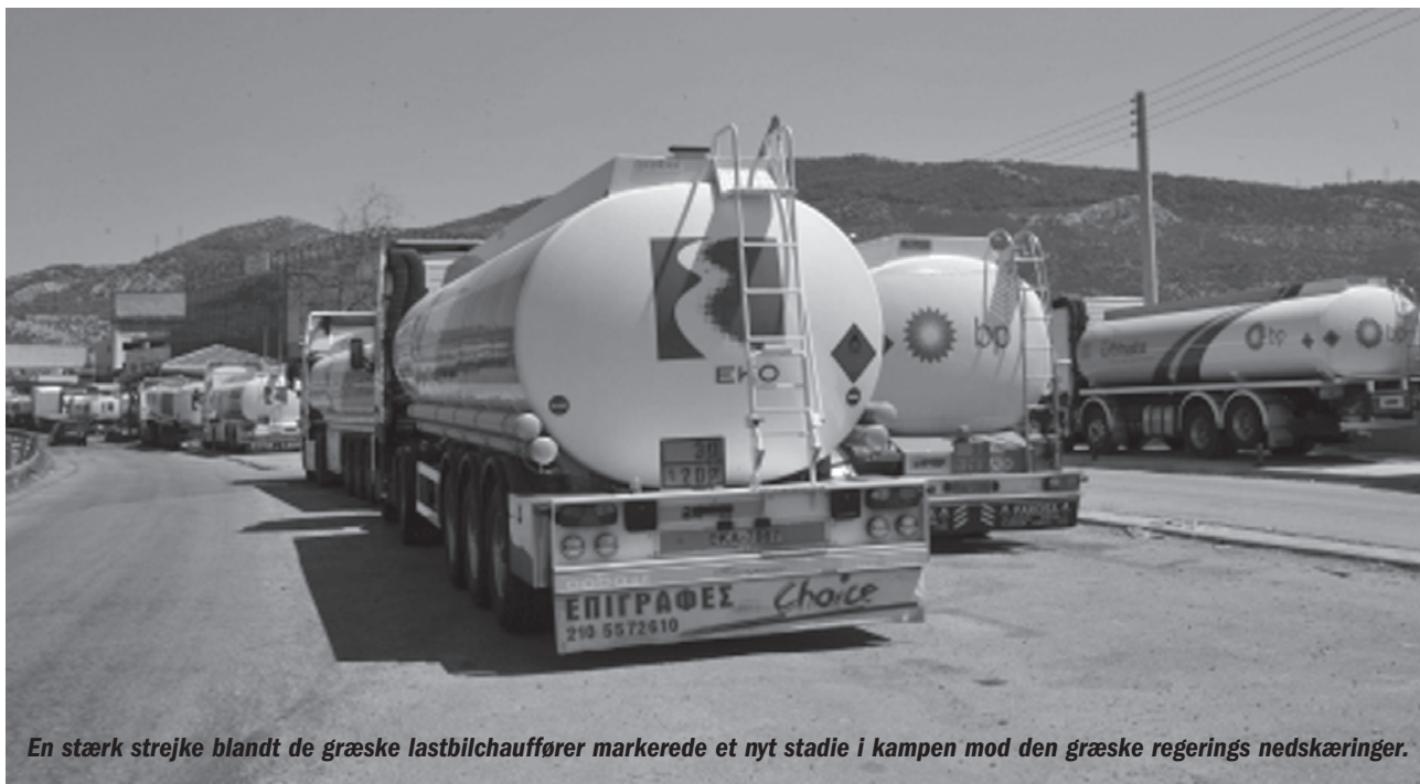
En stærk strejke blandt de græske lastbilchauffører markerede et nyt stadie i kampen mod den græske regerings nedskæringer.

33.000 lastbilchauffører strejkede sidst i juli måned mod åbning af transportområdet for konkurrence. Regeringen måtte bruge en lov fra 1960'erne og 70'ernes fascistiske styre til at indføre undtagelsestilstand, sætte militæret ind og stoppe strejken.