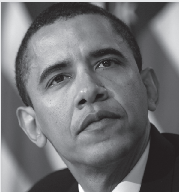
Obama har sendt 30.000 ekstra soldater til Afghanistan for at trække nederlaget ud

Dernæst viser dokumenterne, at Taleban står langt stærkere, end nogen har turdet sige højt. Selv de ekstra