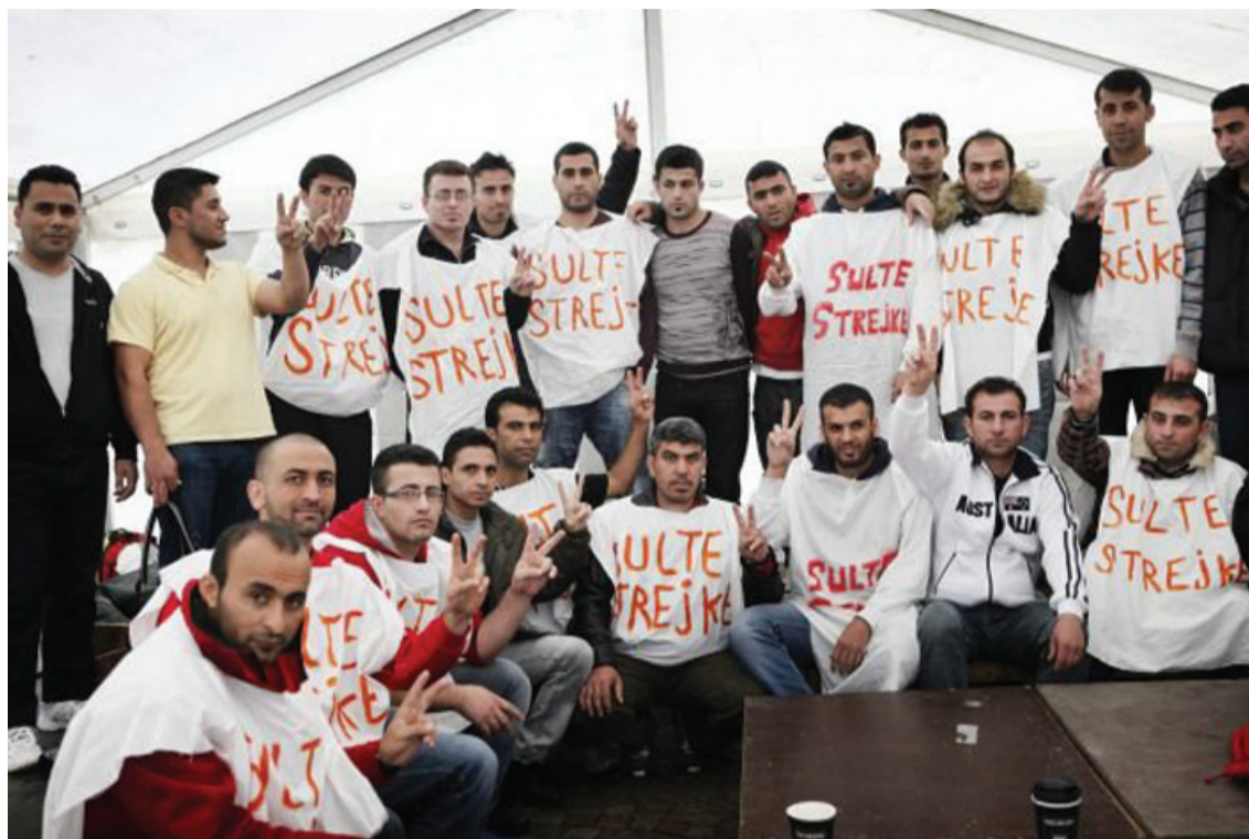
Sultestrejkende kurdere på Christiansborgs Slotsplads

Klokken er 10 om morgenen, og jeg befinder mig på Christiansborg Slotsplads, hvor 15 kurdere har sultestrejket i 15 dage mod tvangsudvisninger til henholdsvis Grækenland og Syrien.