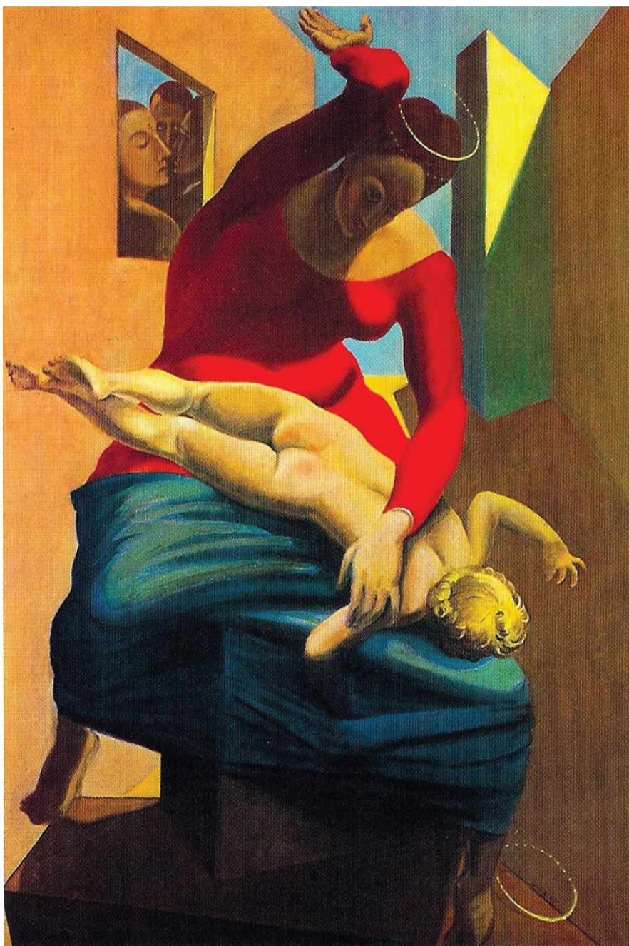
Billede af André Breton med titlen „Jomfru Maria straffer barnet Jesus foran 3 vidner“

Grundlæggende vil en marxistisk tilgang til kunst og litteratur altså insistere på, at disse kulturelle fænomener og praksisser ikke kan forstås isoleret fra det øvrige