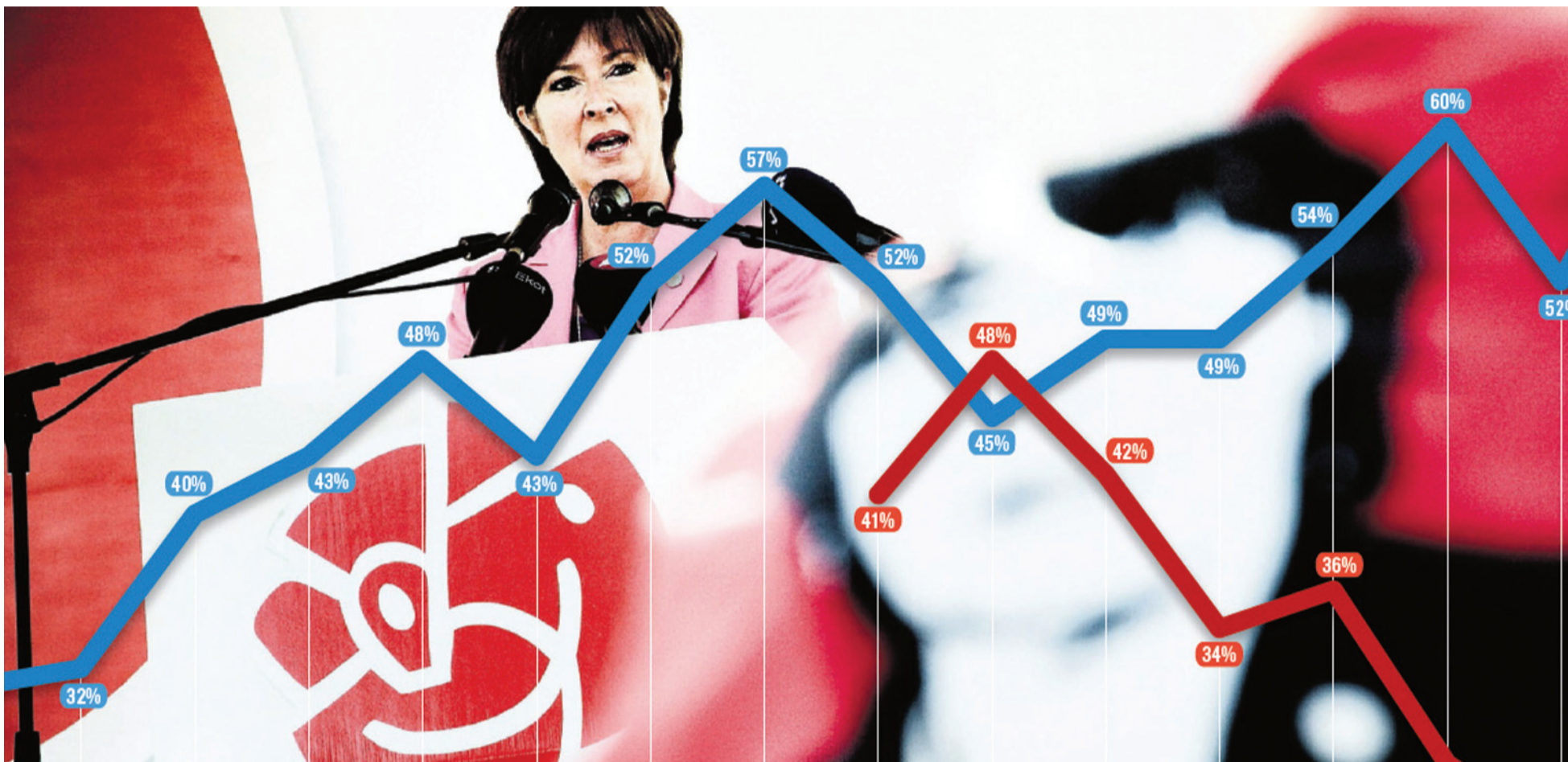
Socialdemokraterne blev valgets store tabere

Mandag d. 20. september 2010 var en sorgens og vredens dag, da det blev klart, at det meget højredrejede parti Sverigedemokraterne (SD) blev valgt ind i parlamentet med 5,7 % af stemmerne - en fordobling ift. stemmerne i 2006. Socialdemokraterne oplevede de værste valgresultater i nært ved 100 år, og de konservative forøgede deres stemmeantal i hvad der nu er et parlament uden et flertal til nogen af blokkene.