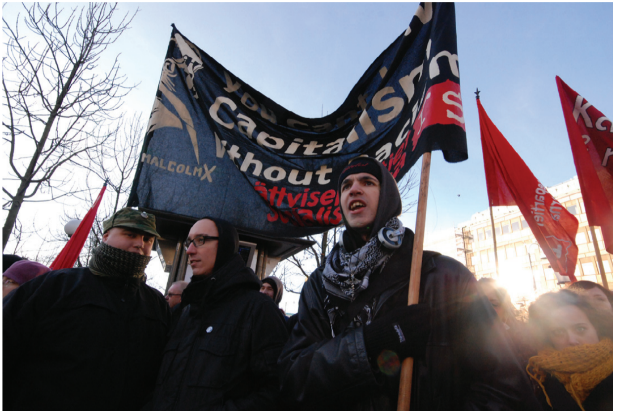
Antiracister fik spoleret flere af Sverigedemokraternes valgsteder, billedet er fra en aktion i Göteborg.

Racisme skal ikke være velkommen i den offentlige debat. Den rammer „de fremmede“ direkte og brutalt. Og den