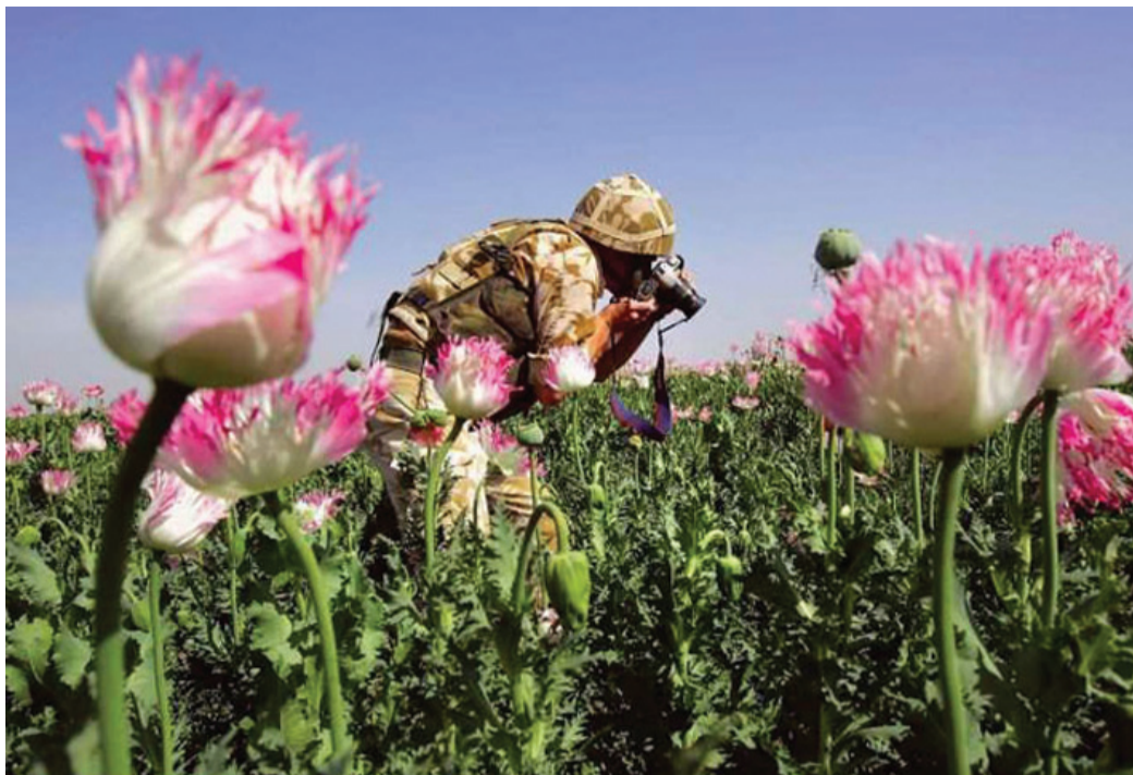
Fredsbevarende styrker, som man fra mange steder foreslår skal styres af FN, kræver i sin natur, at der er en fred som udgangspunkt for at den kan bevares, og det er der ikke i Afghanistan.