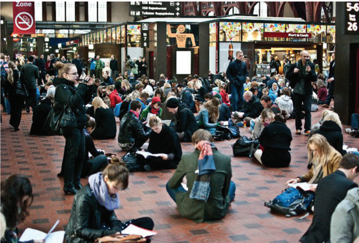
Unge ta'r ansvar lavede flashmob på Hovedbanegården i København, en begivenhed der skabte stor mediebevågenhed

Unge ta'r ansvar er et nyt initiativ bestående af en lang række ungdomsorganisationer, blandt andet LO Ungdom, DGS og PLS. Initiativets hovedformål er indtil videre at opklare demonstrationerne den 5. oktober og lave fordemonstrationer til dem i de forskellige byer.