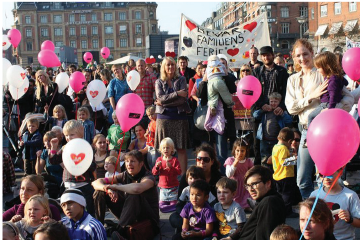
Demonstration på Københavns Rådhusplads den 23. september