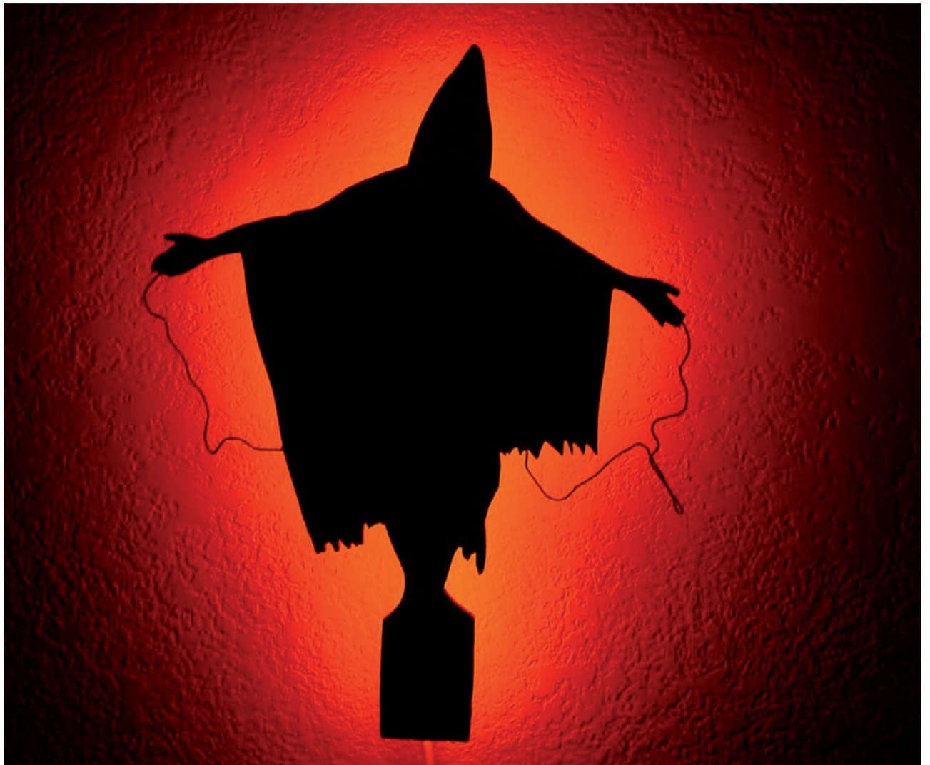
Wikileaks-dokumenterne afslører at danske styrker har udleveret fanger til tortur

Denne undertrykkelse fører til modstand, ofte væbnet. Modstanden støttes af betydelige dele af befolkningen.