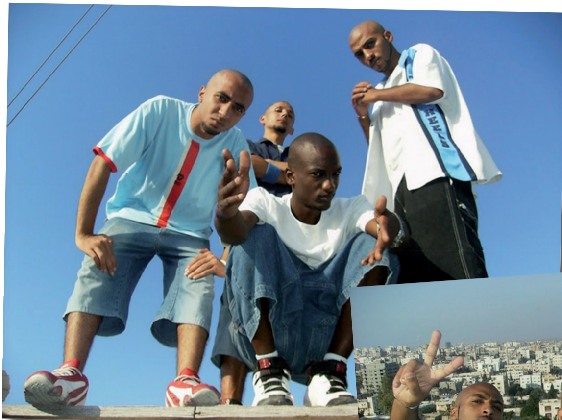
D.A.R.G. team (Da Arabian Revolutionary Guys)

VI HAR LEVET UNDER EN ULOVLIG OKKUPATION I 62 ÅR! HVORDAN KAN MAN KLANDRE ET OKKUPERET FOLK, DER KÆMPE FOR SIN FRIHED? VI HAR RET TIL AT KÆMPE TILBAGE, VI HAR RET TIL AT GØRE MODSTAND, VI HAR RET TIL AT GØRE DET VI KAN FOR AT FÅ VORES LAND TILBAGE.