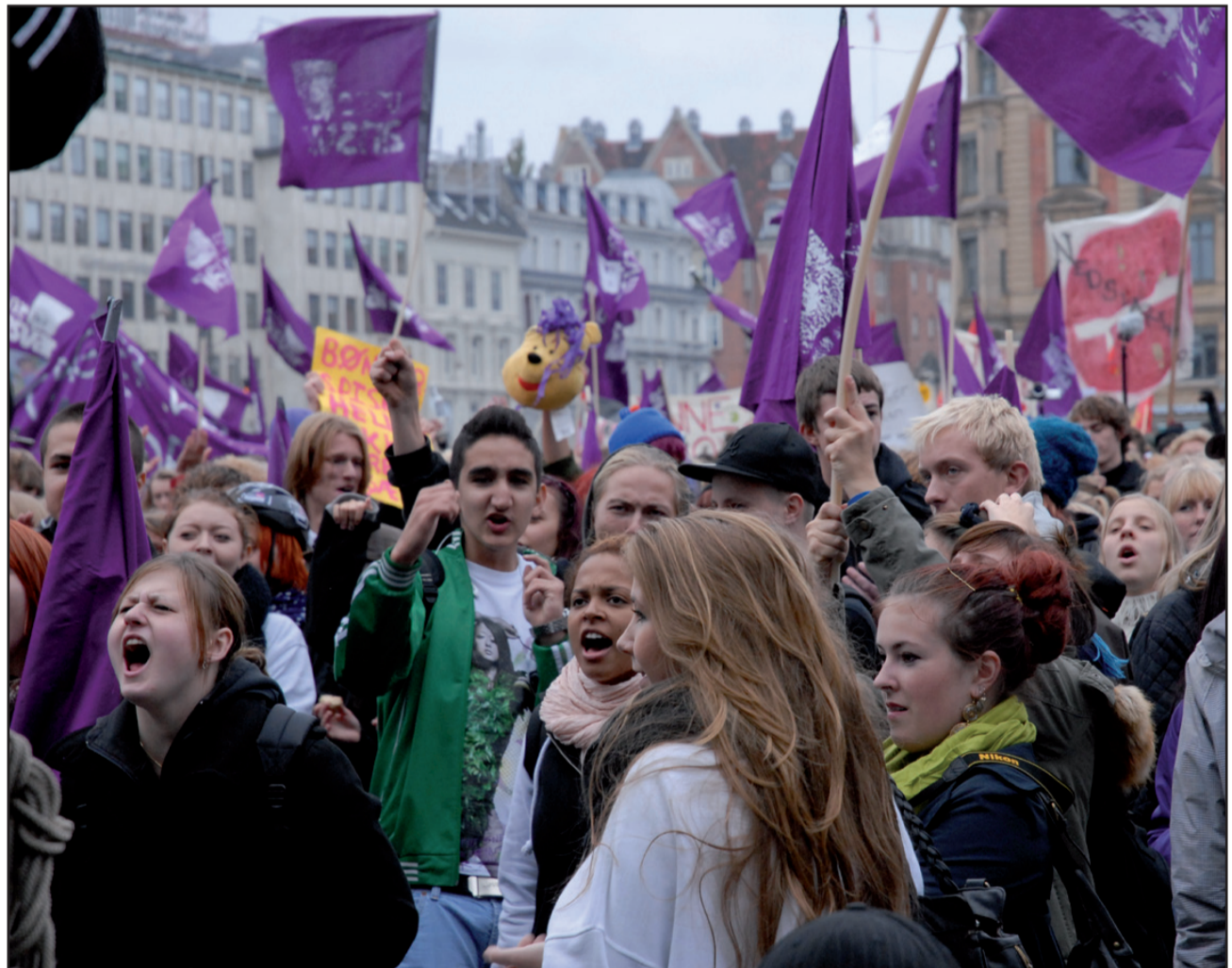
De unge tar ansvar. Alligevel er de en af de grupper der bliver sorteper

Bliver det så bedre med en ny regering af Socialdemokraterne og SF? I de to partiers fælles finanslovsudspil for 2011 skitserer de problemerne, men lover sådan set kun flere penge til sikring af praktikpladser gennem en ny udligningsordning finansieret af virksomhederne. De to partier lægger også op til en forbedring af taxameterbevillingerne til skoler i udkantsdanmark, men taler ikke