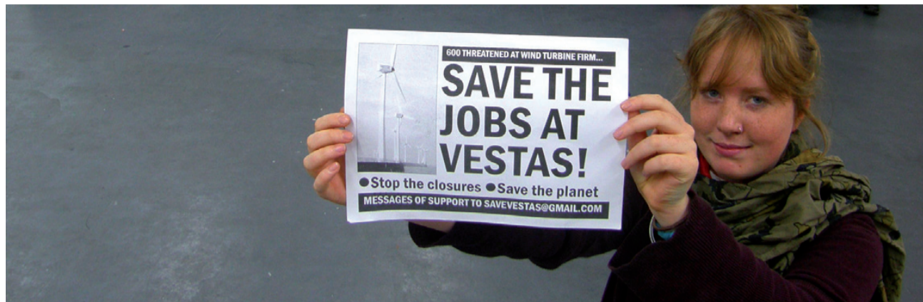
I 2009 foretog VESTAS massive fyringsrunder i England, det satte gang i en stor solidaritetsbevægelse

Vindmøllekoncernen Vestas meddelte 26.10, at de vil fyre 3.000 arbejdere, heraf langt de fleste i Danmark. Fyringerne kommer, mens verden skriger på vindmøller, og mens en ny fyringsbølge er på vej i både den offentlige og den private sektor.