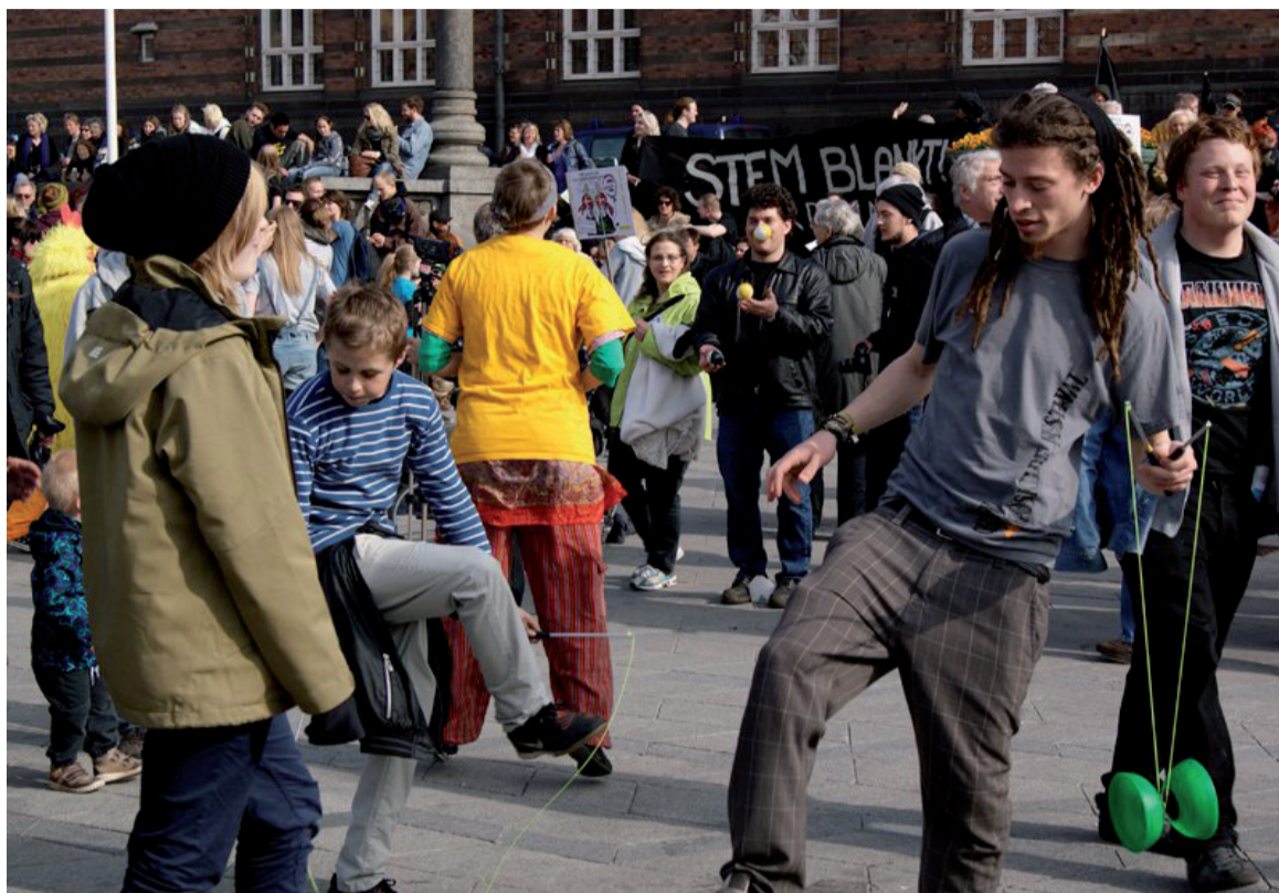
Fra demonstrationen den 2. april

2. april var der indkaldt til demonstration mod VKO-regeringen i København. Mange ville sikkert havde forventet, at oppositionspartierne ville være lykkelige for, at folk fra gulvet tog initiativ til sådan en demonstration.