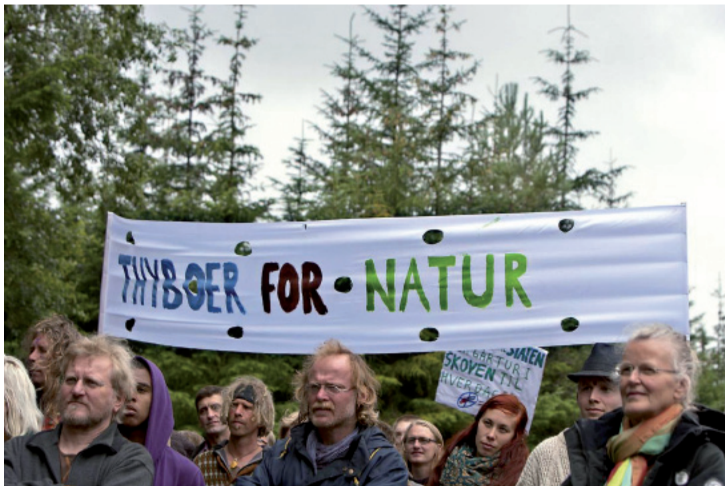
Protester i Østerild

Oprettelsen af testcenteret sker i et område