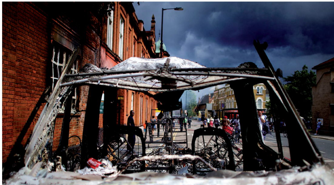
2/3 af Tottenhams ungdomsklubber er lukket ned inden for det sidste år. Her ses bydelen gennem vinduet på en udbrændt politibil.