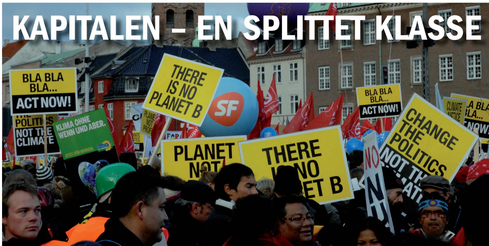
Klimatopmødet i København i 2009 – og de andre klimatopmøder før og efter – viste tydeligt, at verdens magtelite ikke har styr på tingene.

Vi lever i et klassesamfund styret af en lille privilegeret elite, som har magten i kraft af deres kontrol over produktionsmidlerne. Men hvor stor er sammenhængskraften i denne elite? Eller mere præcist: Hvor stor er sammenhængskraften i denne elite i en tid med global krise?