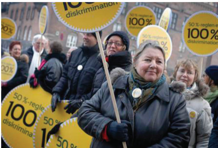
Den udemokratiske 50 % regel for HK'erne blev ikke afskaffet

Når en vagthund holder op med at gø fordi den er bange og bare lægger sig ned, så vil de mest kyniske sige – så skyd den dog. Men så enkelt er det ikke. For de danske lønmodtagere har i den grad brug for den kollektive organisering i disse krisetider. Vi har bare ikke brug for pryglede hunde.