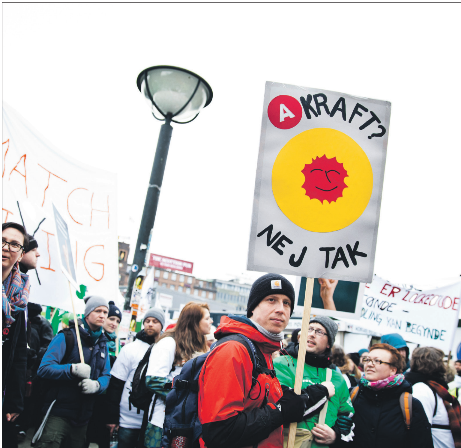
Helle, Corydon og Co. er bestemt ikke populære blandt de lockoutede - A-kraft NEJ TAK

Skulle lærerne bede os om sympatikonflikt vil vi arbejde aktivt herfor.