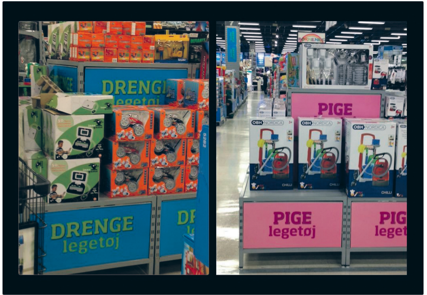
I Bilka vil man også gerne vende tilbage til de gode gamle dage, hvor rigtige drenge legede med motorcykler og søde piger øvede sig i at støvsuge - et billede på at vores kønsidentitet ikke bare er vores eget frie valg.

Dette program er et billede på, at kampen for fri sex, ligeværdighed og gensidig respekt har brug for at blive taget op på ny. Kønsstereotyper og små-sexistisk lommefilosofi har vi rigeligt af.