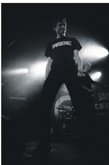
nummeret "Red in the Sky"

Sabotage startede, som så mange andre bands, ud med at spille covernumre, hvor det politiske indhold var den røde tråd hele vejen igennem. Men på et tidspunkt meldte trangen sig til at lave egne numre, og det startede ud med