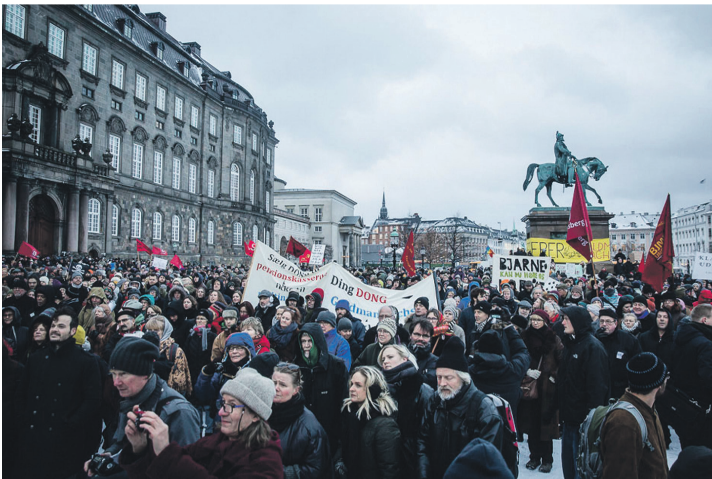
Et andet initiativ fra EL-græsrodder: Demonstration mod det DONG-salg, som endte med at trække SF ud af Thorning-Vestager-regeringen.