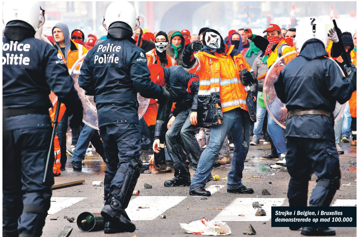
Strejke i Belgien, i Bruxelles demonstrerede op mod 100.000

Følg med på facebook i gruppen Københavns Tekniske Skole Mod Nedskæringer