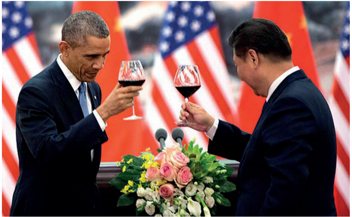
Den amerikanske præsident Barack Obama og den kinesiske præsident Xi Jinping under en statsbanket i Beijing sidste år

Denne hurtige vækst både understøtter udvidelsen af det kinesiske militær og gør det nødvendigt at sikre nye markeder.