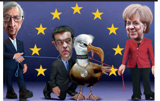
SYRIZA i Grækenland: Fra håb til nedskæringsparti