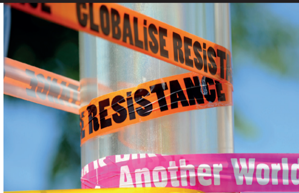
Et parti for de kommende kampe