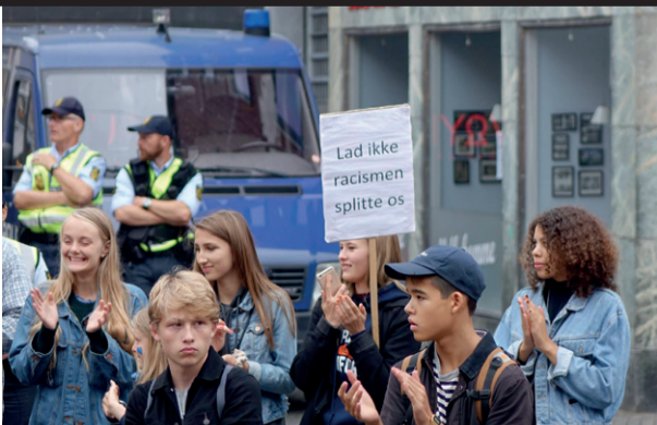
Folkebevægelse mod fremmedhad

Nej til racisme og nedskæringer Ud med Løkke og DF