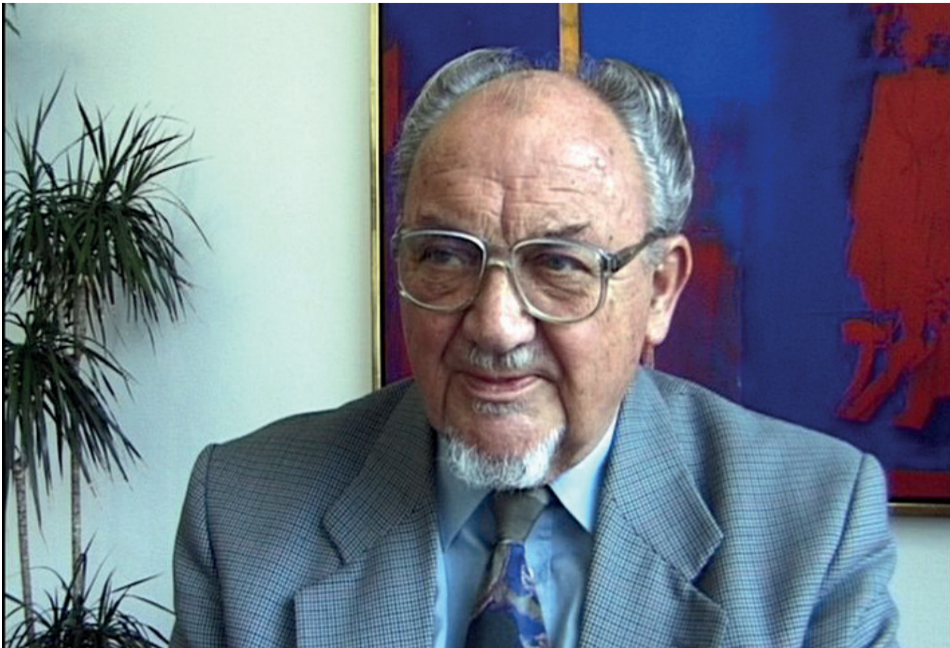
Anker Jørgensen var fagforeningsformand fra 1968 til 1972 og statsminister fra 1972-73 og 1975-82. En klassisk repræsentant for den socialdemokratiske reformisme.